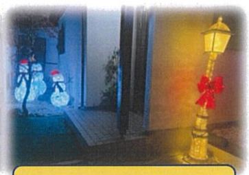
四丁目 大津さん邸