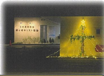
姉ヶ崎キリスト教会

年の瀬が迫る12月に入ると各町内では、あちらこちらで、クリスマスのイルミネーションをお庭やお家の壁を飾って、楽しまれているお宅が、目立ちはじめました。お買い物帰りやお散歩中の皆さんの目を楽しませている風景をご紹介します。