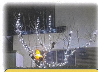
三丁目 増田さん邸