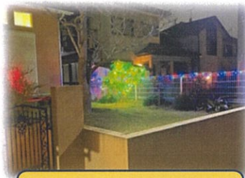
一丁目 菊谷さん邸