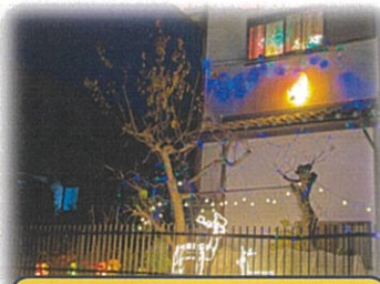
一丁目 本荘さん邸