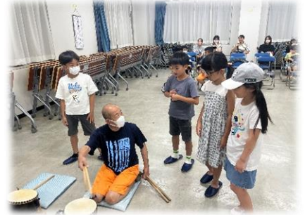
子供太鼓練習会の様子