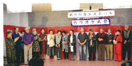
カラオケ出演者のみなさん

二日目午前の青空広場では野菜や園芸品、菓子類に加え、花ボランティアの出品などがありました。青空市場の売れ行きも順調で、例年以上の活況でした。