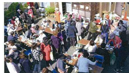
活況の憩いの広場

憩いの広場では、防災部と婦人会さくらの皆さんの心温まるカレーとお汁粉が振る舞われ、大勢の皆さんのお腹を満たしました。