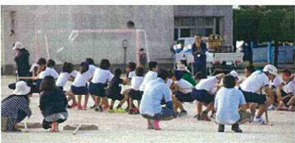
小学校対抗綱引き優勝

桜台チームは年のせいか、なかなか点数が伸びない中で、健闘したのが地区対抗リレーでした。