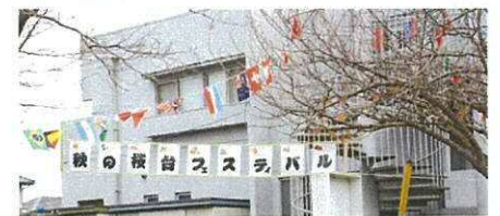
作品展示会場入口では

11月5日(土)、6日(日)の二日間にわたり自治会館において桜台フェスティバルが開催されました。