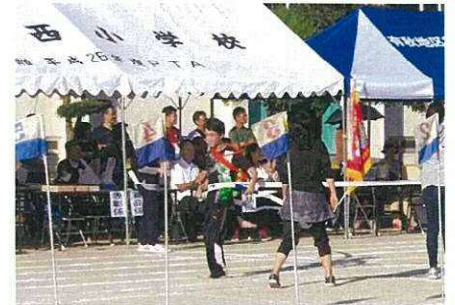
地区対抗リレー優勝