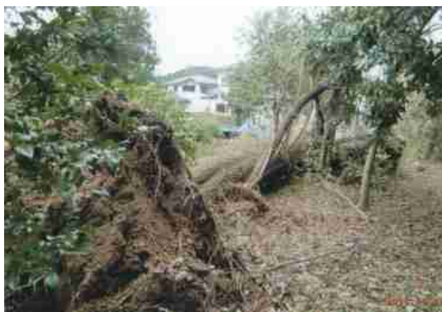
三丁目のバス停付近です。