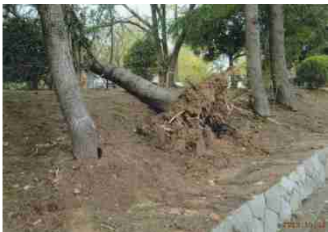
一丁目の街路樹です。