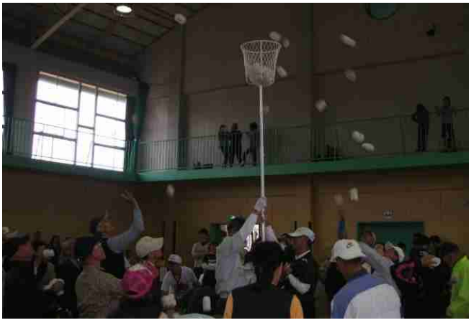
白籠がとても高いです。