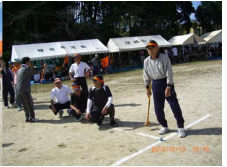
めざせホールインワン。1組1位。日頃の練習成果が活きる。