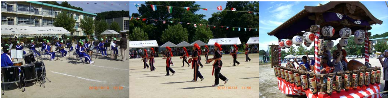
有秋中学校の生徒による沖縄民謡エイサー踊りと吹奏楽演奏。