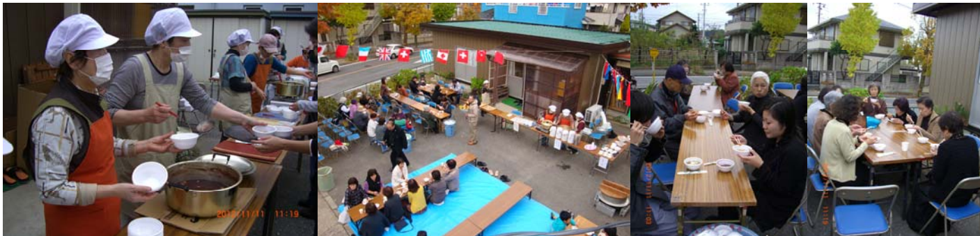
芋煮とおしるこでおもてなしました。