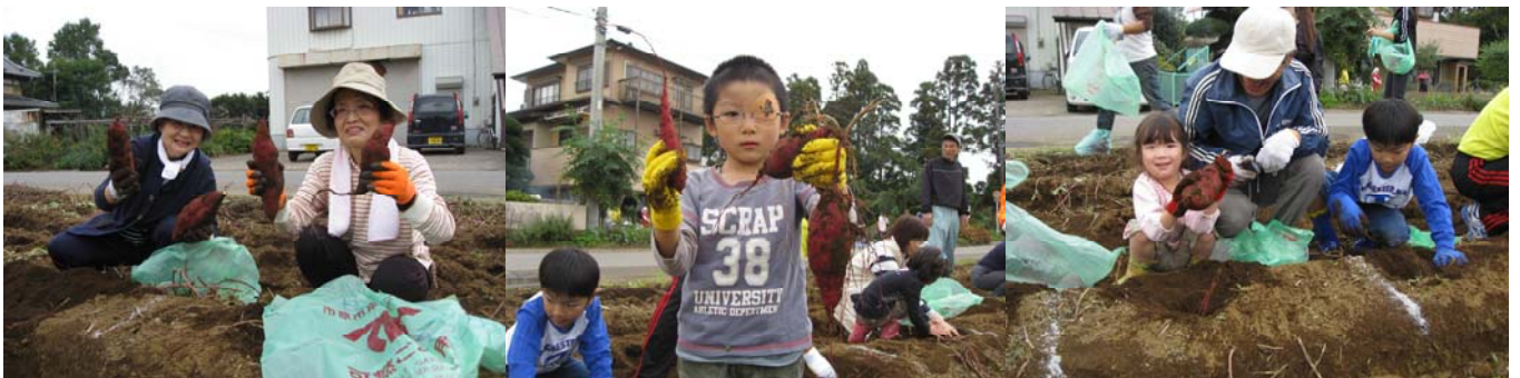
みんな大きなさつまいもを掘り、ご満悦。