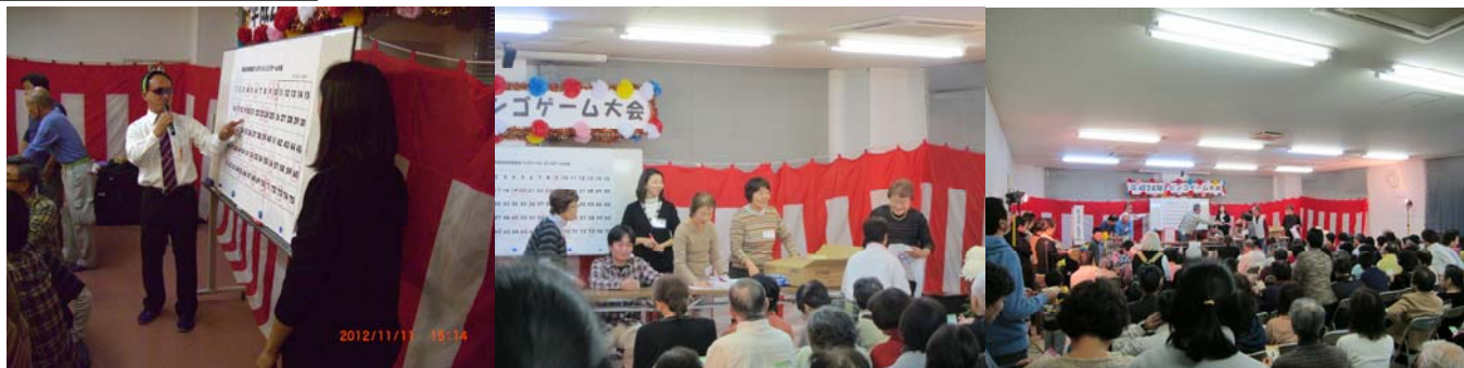
フェスティバルの最後を締めくくるビンゴ大会。賞品多数で盛り上がりました。