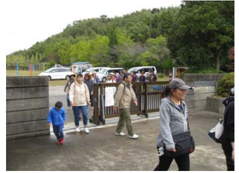
有秋南小学校に集合し、 出発。

平成24年10月28日 日曜日にファミリーハイキングと芋掘りが開催されました。あいにく、有秋公民館祭と日程が重なり、桜台からの参加者は少なめでしたが、雨に降られることもなく無事終了しました。