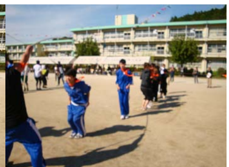
長縄跳び。1回目14回。2回目17回。合計31回で2位。