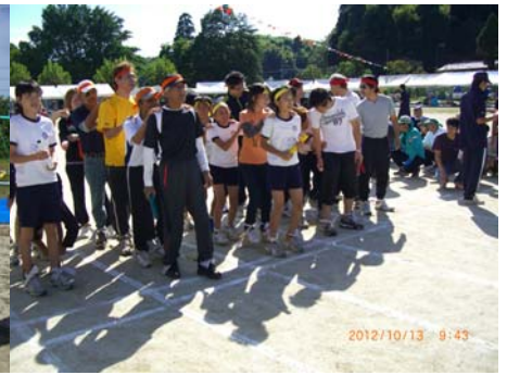
ムカデくん。1組5着。全員の足並みを揃えるのが難しい。