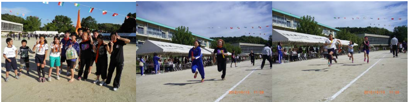
地区対抗リレー。予選を 2 組 2 着で通過し、決勝で先行するも惜しくも緑園都市チームに逆転され、2 位。