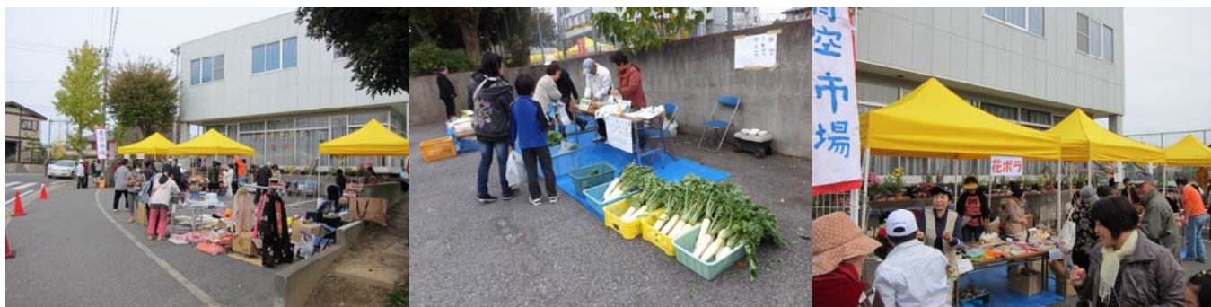
野菜コーナー、手芸品、クラフト等、色んな品物が出店されていました。