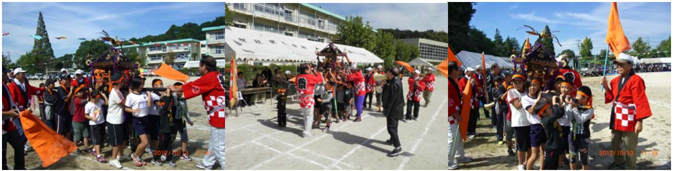
祭太鼓。桜台を含む子供神輿 3 台が参加。