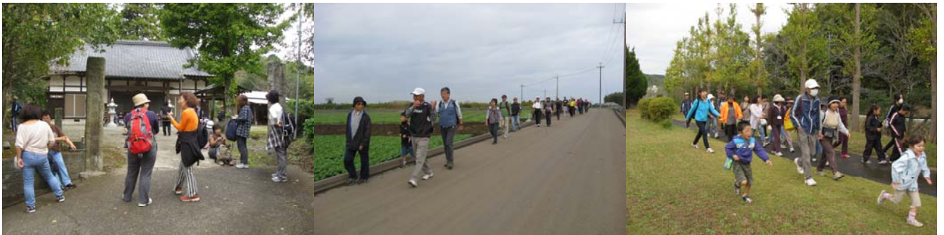
途中、天羽田、安誠寺を經由して、鎌田農園まで6.5kmのハイキング。