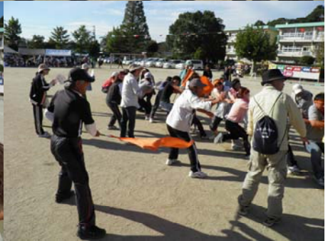
綱引き。予選を2勝1敗で通過し、準決勝で敗れ、3位。