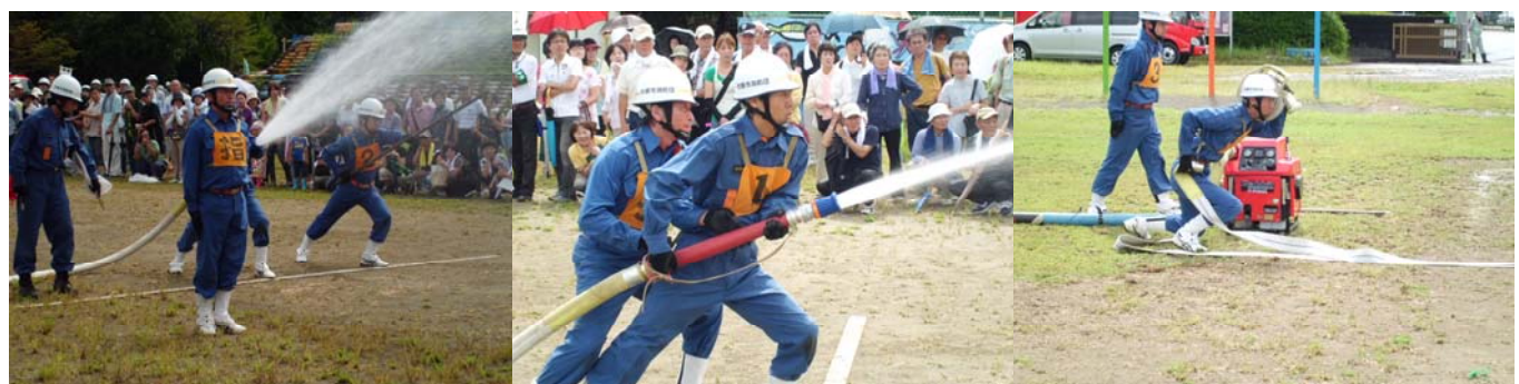
消防団による小型ポンプ操法演技の披露