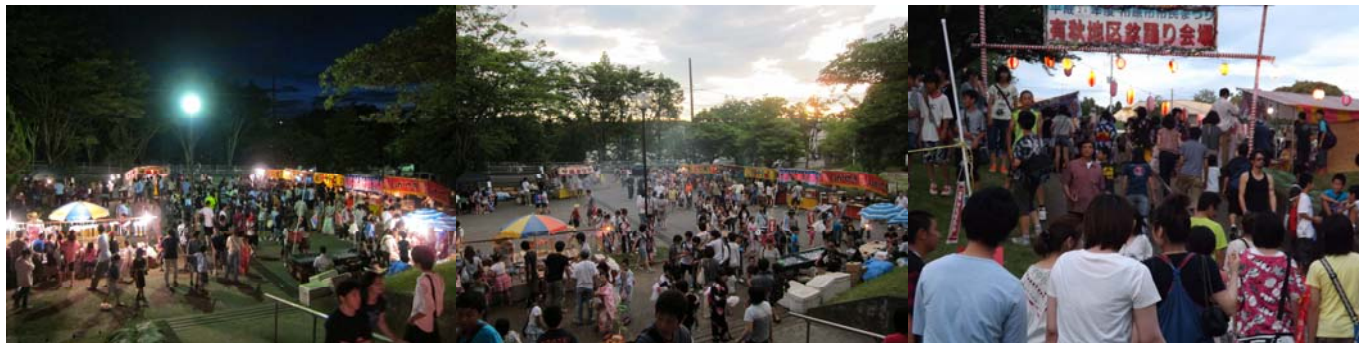
有秋地区盆踊り大会の様子。かなりの人出でした。

九月二日(日) 8時45分から、大地震を想定した市原市総合防災訓練が実施されました。当日はあいにくの雨の中での訓練となりましたが、指定避難場所の有秋南小学校での地域・学校一体型の訓練には、桜台から過去最高参加人数の350人強のほか、深城・天羽田・椎の木台・みどり町会を含め総数600人強の住民の方が参加しました。