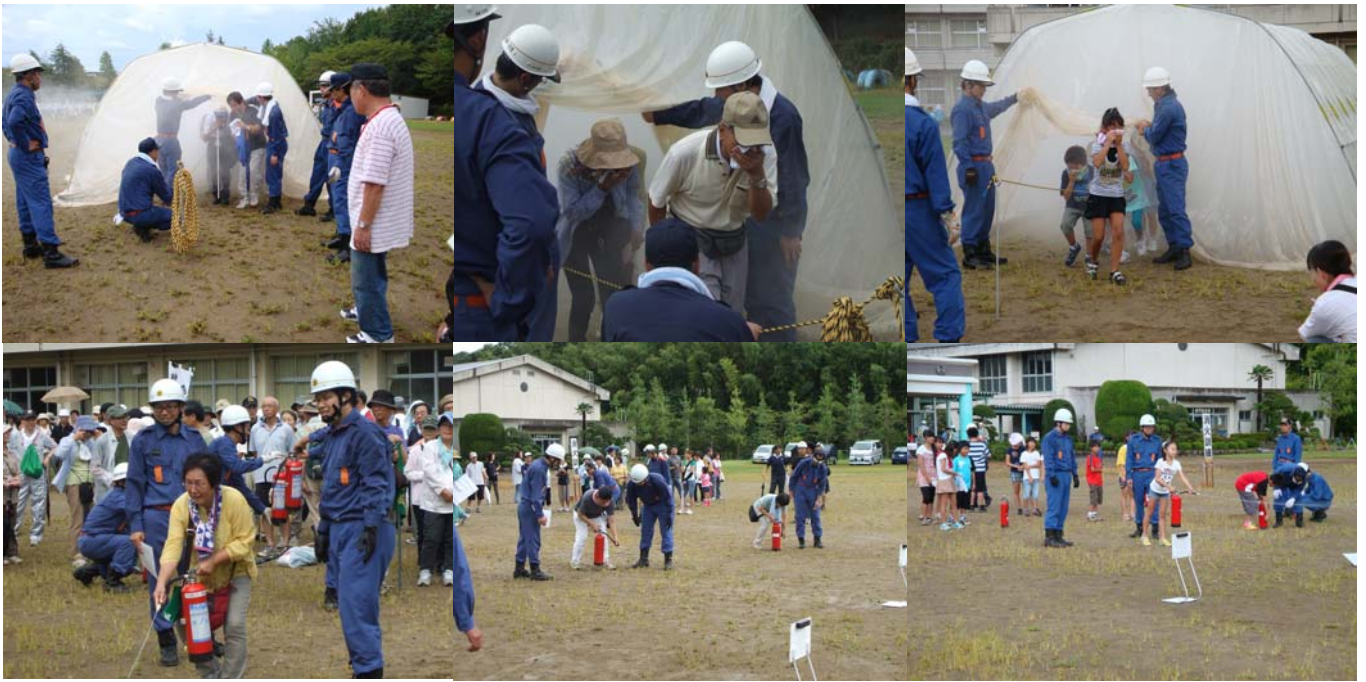
火災を想定した煙道体験訓練と初期消火訓練で消火器の使用方法を練習