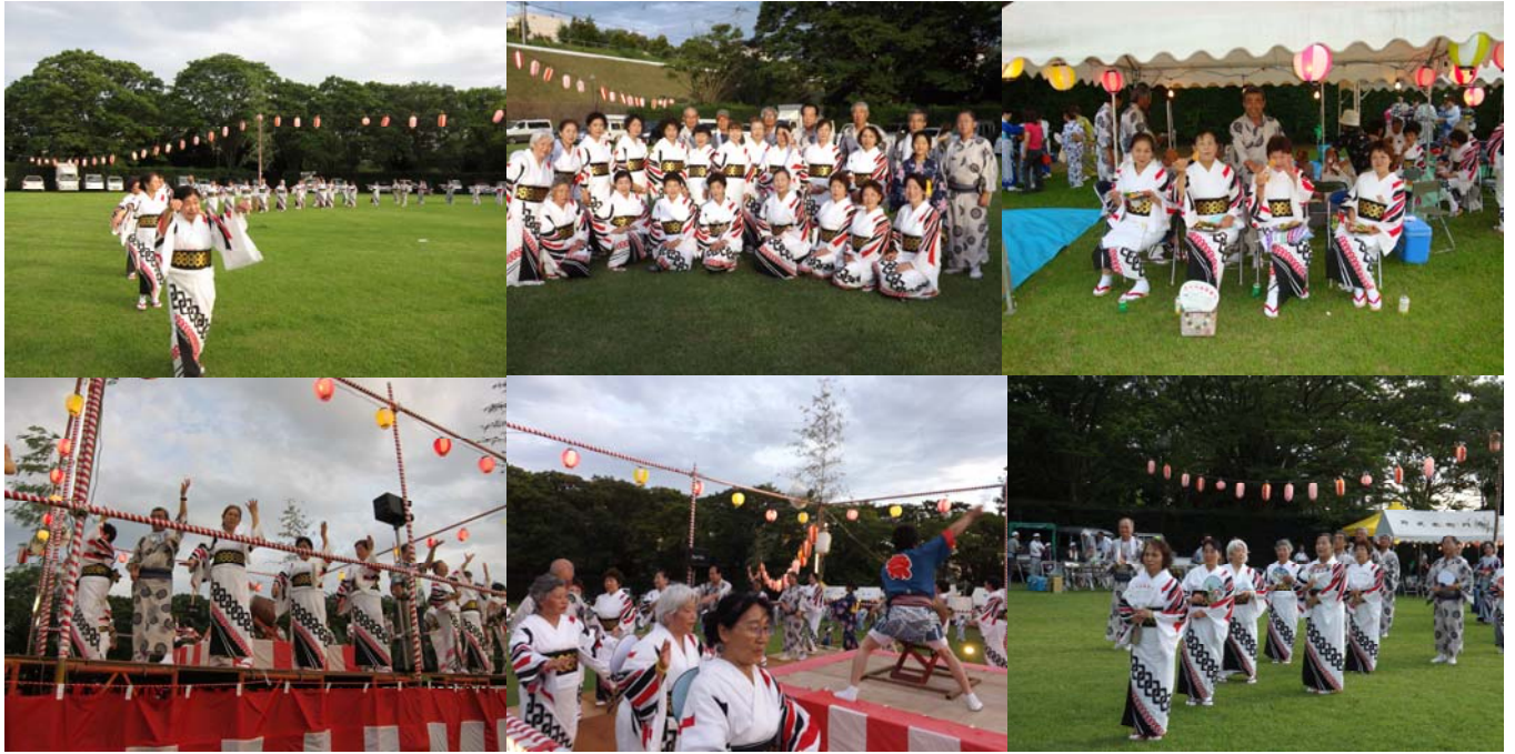
桜台自治会からの参加者による踊りの様子