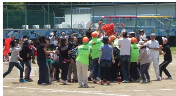
有秋南小学校大運動会への参加の様子