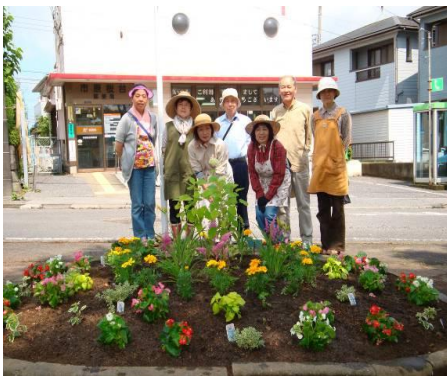
花ボランティアのみなさま