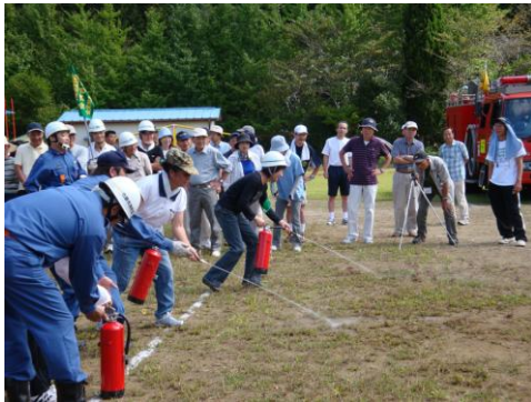
防災訓練活動風景

日頃の活動では諸先輩の経験もいただきながら、基本に立ち自主、自助を目指して皆さんの協力を得ながら進めたいと思います。