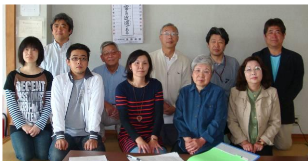
<広報部 新メンバー>

●開催日など詳しい内容は自治会事務所（TEL：66-1341）までお問い合わせ下さい。