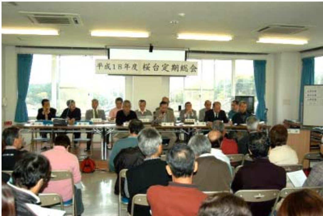
役員 of 皆さん