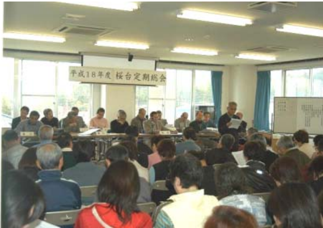
専門部長さんの発表