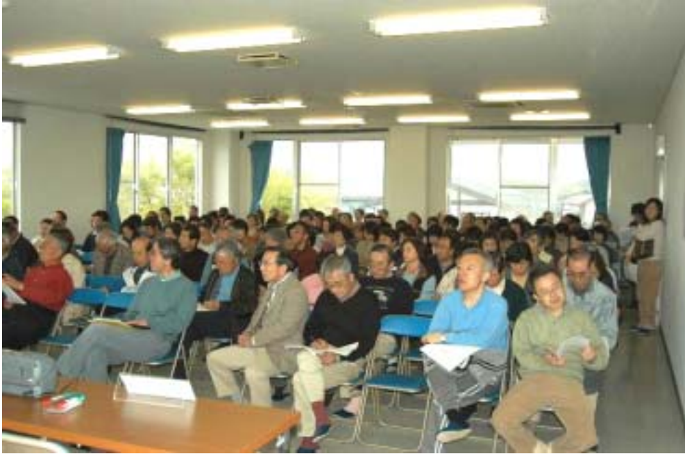
総会参加の皆さん