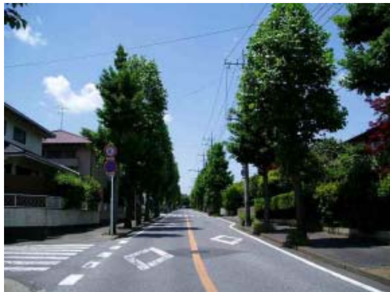
桜台の風景(春から初夏への移り行き)

本レポートを入手ご希望の方は、自治会事務所に用意してあります。 本レポート(年4回発行予定)の表紙を飾る写真、絵を募集してます。