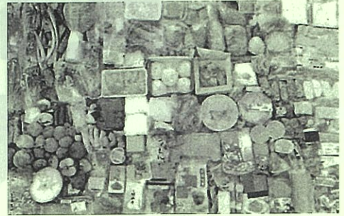
捨てられた手付かずの食品例

まだ食べられるのに捨てられてしまう食品のこと。 日本では、年間500万トン以上の食品ロスが発生しています。 食品ロスの中には、手付かずの状態ですてられている食品もあり、この状況を多くの方に知っていただくことが大切です。