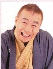
立川談慶 落語立川流真打ち

1960年8月生まれ。昭和58年、家業のコイデ陸運㈱に入社し、平成7年に同社代表取締役任に就任、東京湾岸交通株式会社を設立。その後、市原ベイタクシー㈱を設立し、トラック、バス、タクシーの3つの運送業の経営者として手腕を発揮する。平成15年、市原市議会議員に当選。3期12年にわたり市議会議員を務め、平成27年、市原市長に就任。「対話と連携」を市政運営の柱とし、現在3期目を務めている。