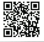
市民会館ウェブサイト