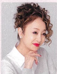
南美希子 エッセイスト・TVコメンテーター

1965年生まれ。野村万蔵家九代目当主。重要無形文化財総合指定。「萬狂言」「万蔵の会」を主宰。国内外にて公演を行い、新作の創作・演出も手掛け、流派を超えた「立合狂言会」を発足、南原清隆氏との「現代狂言」「古今狂言会」を催すなど、狂言の普及と発展に尽くしている。2022年「初世野村万蔵生誕三〇〇年祖先祭」にて文化庁芸術祭大賞を受賞。NHK大河ドラマ「西郷どん」では三条美美を演じた。