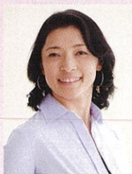
勝間和代 経済評論家

1968年東京生まれ。経済評論家。早稲田大学ファイナンスMBA、慶応大学商学部卒業。当時最年少の19歳で会計士補の資格を取得、大学在学中から監査法人に勤務。アーサー・アンダーセン、マッキンゼー、JPモルガンを経て独立。現在、株式会社監査と分析取締役、中央大学ビジネススクール客員教授として活躍中。著作多数、著作累計発行部数は500万部を超える。