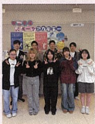
帝京平成スポーツアカデミー ※ 帝京平成大学 健康医療スポーツ学部

1965年11月16日長野県上田市生まれ。1988年慶応義塾大学経済学部卒業後、株式会社ワコールへ入社。1991年同社を退社し、立川談志門下へ入門。前座名「立川ワコール」。2000年二つ目昇進。談志により『立川談慶』と命名。2004年真打ち昇進。慶応大初の落語家として活躍中。