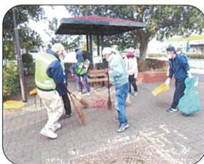
有秋地区の公園清掃