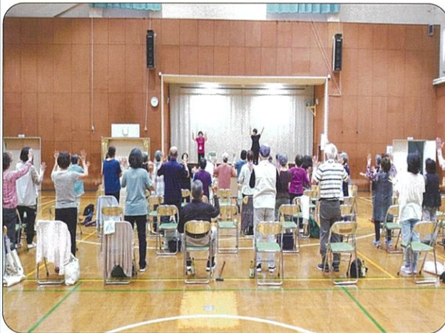
健康体操（参加者59名） 6/6（木）