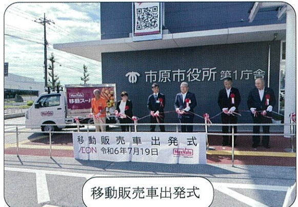
移動販売車出発式

有秋地区社会福祉協議会拠点確保 6月3日より有秋フラザ内に事務所を開設しました。