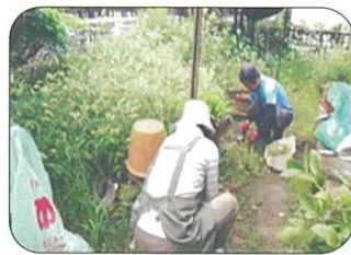
くらしのささえあい