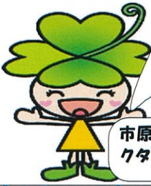
市原市社協公式キャラクター《よつばちゃん》

ろでございます。最後にお願いでございますが、これらの活動を進めていくには資金が必要で、住民の皆様におかれましては、住民会費並びに賛助会員へのご協力を切にお願いいたします。今後とも「住んで良かった有秋地区」となるよう努力してまいりますので、ご支援をよろしくお願いいたします。