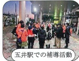
五井駅での補導活動

青少年の犯罪を未然に防ぐため「青少年非行防止」と「青少年健全育成」に向け真摯に活動してまいりますので、ぜひ応援をいただきたくよろしくお願いいたします。