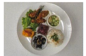
※写真は昨年度スパイス&ハーブを使った料理