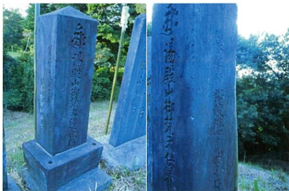
湯殿山御梵天供養塔：宝暦9年（1759）これも供養塔としては市内最大級

分を過ぎていたでしょう。急いで車を飛ばして能満の四辻に到着した頃には早くも薄暗くなった林からヒグラシの鳴き声が盛んに聞こえてきます。ここを訪れるのは初めてだったのでつい塚の裏側から登ってしまいました。暗くなり過ぎては写真撮影に支障が出てしまうのでかなり焦っていたのです。