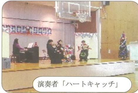
演奏者「ハートキャッチ」

12月3日(日)14時から有秋公民館体育室でクリスマスコンサートを開催し、お菓子の詰め合わせと有秋公民館からの焼き芋をプレゼントしました。また、一人世帯の高齢者にクリスマスプレゼントをしました。