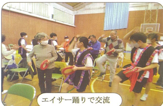
エイサー踊りで交流