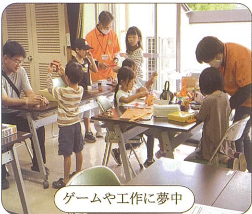
ゲームや工作に夢中