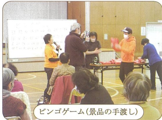
ビンゴゲーム(景品の手渡し)

12月7日(木)に開催されたスマイルサロンは地域福祉支援事業とコラボしての開催でした。第2クローバー学園の皆さんが参加され、有秋中学校2年生とエイサー踊りで交流したり、ビンゴゲームで楽しんだり盛り沢山の内容で66名の参加者の皆さんに喜んでいただきました。