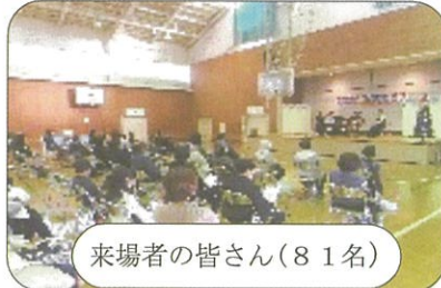
来場者の皆さん(81名)

永藤公園と中央公園の2か所を毎月第3土曜日午後2時30分から清掃を行っています。