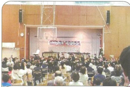
有秋中・姉崎東中吹奏楽部の演奏

12月17日(日)13時30分から有秋公民館体育室でクリスマスコンサートを開催(有秋中、姉崎東中吹奏楽部、マリンバ、ソプラノ、ピアノの演奏)し、お菓子の詰め合わせをプレゼントしました。