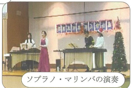
ソプラノ・マリンバの演奏

来場者は、有秋南小学校区の沢山の住民の皆さんと有秋中・姉崎東中吹奏楽部員の保護者の皆さんや一般の皆さんで、289名でした。