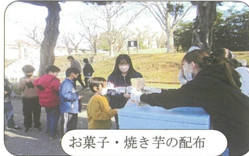
お菓子・焼き芋の配布

サツマイモで焼き芋のプレゼントをしました。寒い中の焼き芋は大好評でした。皆さんありがとうございました。