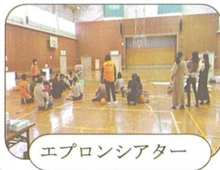
エプロンシアター