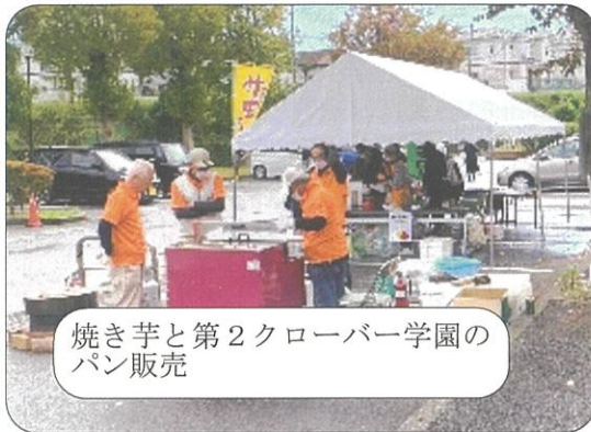
焼き芋と第2クローバー学園のパン販売

10月29日(日)に福祉バザーを4年ぶりに開催しました。新型コロナウイルス感染症の影響により中止期間が長かった事により、記憶を探りながらの準備、本番でしたが関係者の皆さまのご協力により無事に実施することができました。 今回も食品、日用品、野菜、衣料品、雑貨等多くの提供品をいただき大変ありがとうございました。また、各町会・自治会、各小学校区ネットワーク、民生委員児童委員、更生保護女性会、