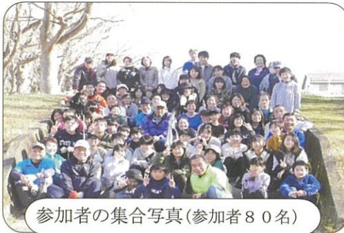
参加者の集合写真(参加者80名)

12月9日(土)9時から有秋公園の大掃除を実施しました。参加者全員にお菓子・飲み物・カップ麺等と有秋公民館から提供いただきました。