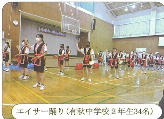
エイサー踊り(有秋中学校2年生34名)