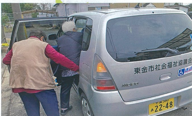
高齢者や障がいなどのために、公共交通機関での移動が困難な方の外出をサポートしています。【東金市】