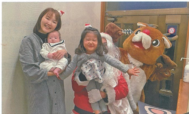
お子さんがいる家庭をボランティアが訪問して交流し、「地域での子育て」を行っています。【御宿町】