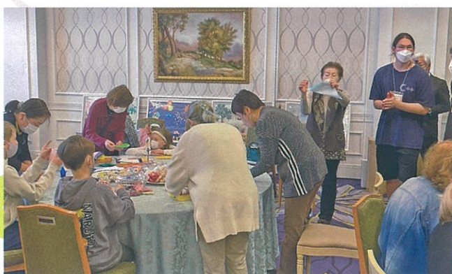
ウクライナから避難してきた方々が集う場を開催し、日本で生活を支援しています。【千葉市】