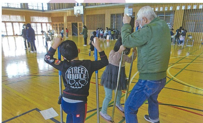
地域の小学生と高齢者が竹馬やおはじきなどの「昔遊び」を通じて交流しました。【長南町】