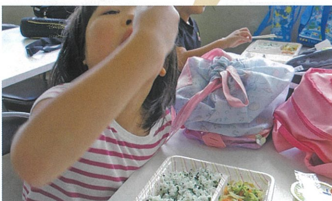
放課後児童クラブに通う子供たちにお弁当をお届けする「楽々kidsランチ」を開催しました。【睦沢町】