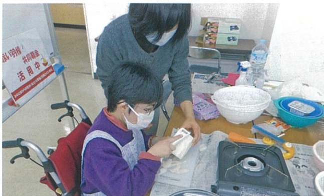
アドバイザーが中心となり、身体に障がいのある方たちへの就労相談や自立支援を行っています。【千葉市】