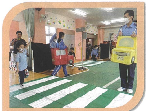
交通安全モデル園で、幼児(5歳児)を対象とした交通安全教室(1回目)を実施しました。

道路に出るときは、飛び出さずに「 止まる・見る・待つ 」ことを習慣づけるよう、大人がお手本となって繰り返し教えましょう。