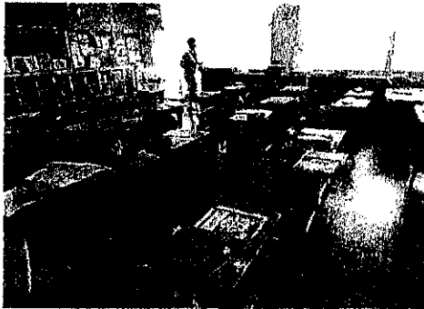
9月1日(金) ワンポイント避難訓練 「まず低く 頭を守り 動かない」