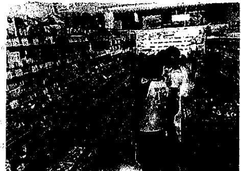
9月12日(火) スーパー見学(3年) たくさんの工夫を見つけました。買い物体験もしました。