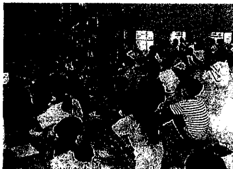
9月5日(火) 陸上部説明会 11月の大会に向け、いよいよ陸上部の活動がスタートします。