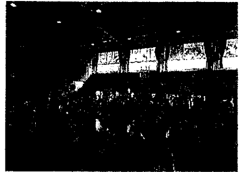
9月1日(金) 全校集会 夏休み明けでしたが、集中して話を聞くことができました。