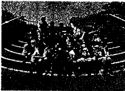
6/29 (木) ~ 30 (金) 5年宿泊学習 天候にも恵まれ、大房岬自然の家で最高の思い出ができました。