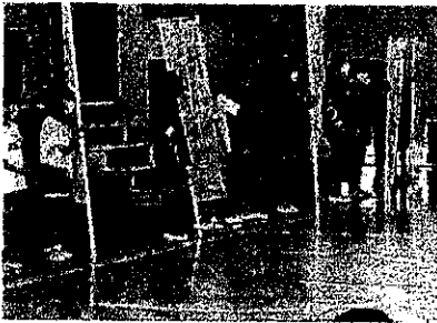
6/21 (水) いじめゼロ集会 いじめゼロに向けて、各学級がスローガンを発表しました。