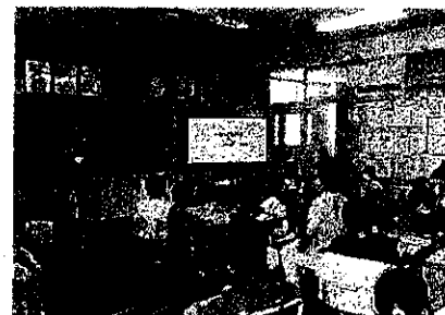
7/7 (金) 4年 SDGsを学ぼう 市役所から講師をお招きし、ゲームを通してSDGsについての理解を深めました。家庭教育学級の1講座として、保護者の方にも参加いただきました。