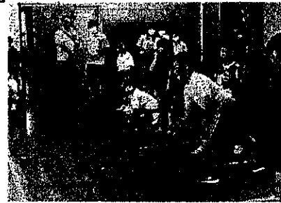
6/24 (土) 有秋地区ポッチャ大会 4年生チームと6年生チームが参加 4年生チームが見事優勝!!