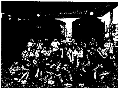
7/7 (金) 3年校外学習 梨農園、小湊鐵道の乗車、市原湖畔美術館を見学しました。