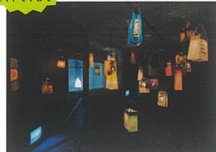
- 岩沢兄弟 - いさわひろし (兄)・いさわたかし (弟)