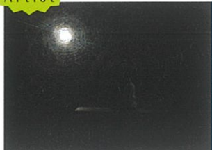
- 千田 泰広 - Yasuhiro Chida