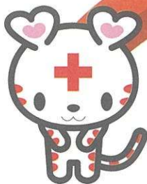
日本赤十字社キャラクター ハートラちゃん