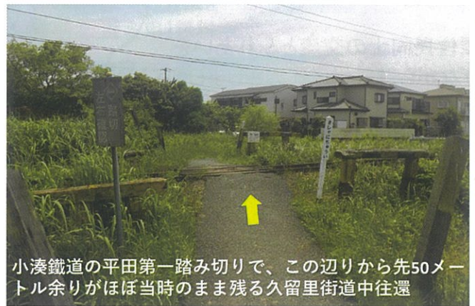
小湊鐵道の平田第一踏み切りで、この辺りから先50メートル余りがほぼ当時のまま残る久留里街道中往還

一基、それに起点の庚申塔道標一基を合わせて合計で八基となります。写真はほぼ江戸時代当時の面影を残す「殿様道」でこの後多少、道幅の変更を伴いますが、ここから200メートルほど先の平田第二踏み切りまでが参勤交代に使われた道と考えられます。なお平田第二踏み切りから先は小湊鐵道の線路となっていて、現在は歩いて辿ることが出来ません。