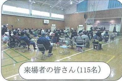
来場者の皆さん(115名)