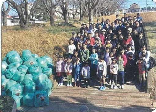
参加者の集合写真(参加者63名)

12月10日(土)9時から有秋公園の大掃除を実施しました。参加者全員にお菓子・飲み物・カップ麺等と有秋公民館から提供いただいた