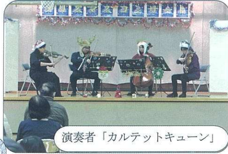
演奏者「カルテットキューン」

12月4日(日)14時から有秋公民館体育室でクリスマスコンサートを開催し、お菓子の詰め合わせと有秋公民館からの焼き芋をプレゼントしました。また、一人世帯の高齢者にクリスマスプレゼントをしました。