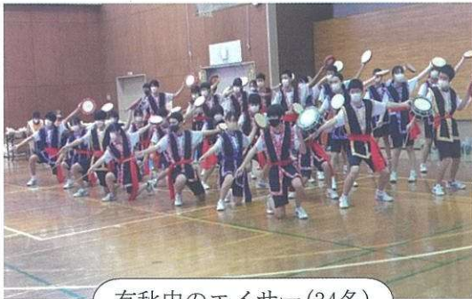
有秋中のエイサー(34名)