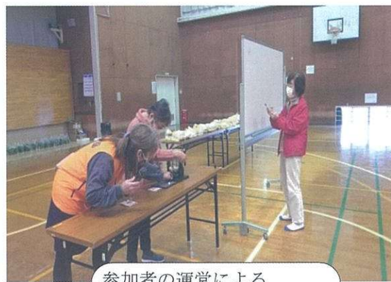
参加者の運営による ビンゴゲーム(参加者53名)

12月8日(月)に開催されたスマイルサロンは地域福祉支援事業とコラボしての開催で盛り沢山の内容でした。有秋中学校3年2組の皆さんによるエイサー踊りの披露、参加者の皆さんがパーランクーを持って、踊り・叩き方を教えてもらい最後に一緒に踊りました。難しかったけど熱心に教えてくれたので何とか踊れ、終わった後は拍手喝采でした。