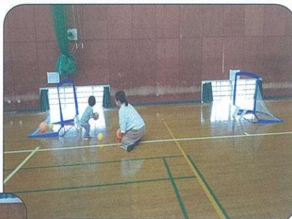
サッカーボール遊び(参加者30名)