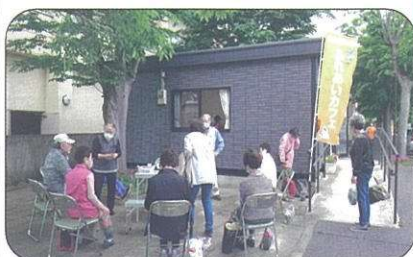
『オアシス有秋』テラス

支所・公民館に来られた方、 散歩中のあなた！ テラスでコーヒー、お茶を 飲みながらおしゃべりしま せんか 電話も待ってまーす 無料です カフェ専用電話 ☎070-5589-8226