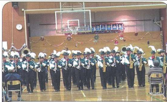
袖ヶ浦高校吹奏楽部の演奏(来場者100名)

12月18日(日)13時30分から有秋公民館体育室でクリスマスコンサートを開催(袖ヶ浦高校吹奏楽部の演奏)