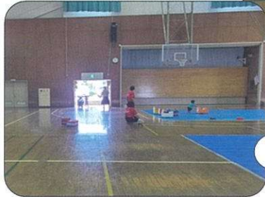
ゴー・ゴー・ゴーカート