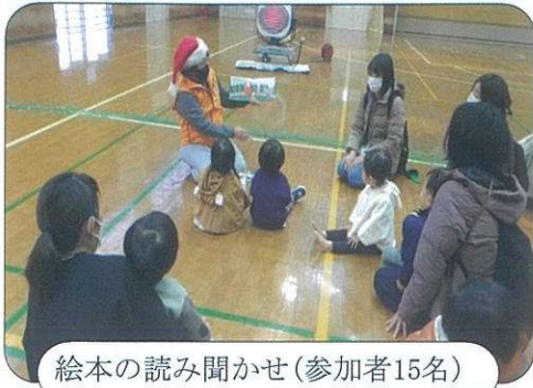
絵本の読み聞かせ(参加者15名)