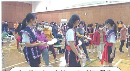
パーランクーを持って一緒に踊る

12月8日(月)に開催されたスマイルサロンは地域福祉支援事業とコラボしての開催で盛り沢山の内容でした。有秋中学校3年2組の皆さんによるエイサー踊りの披露、参加者の皆さんがパーランクーを持って、踊り・叩き方を教えてもらい最後に一緒に踊りました。難しかったけど熱心に教えてくれたので何とか踊れ、終わった後は拍手喝采でした。