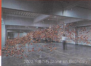
2022 下境の石-Stone on Boundary.

1979 年大阪府出身。 国内外の展覧会やアートプロジェクトにて活動している他、アーティスト・イン・レジデンスにも参加。