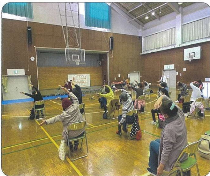
健康講話・健康体操 (参加者48名)