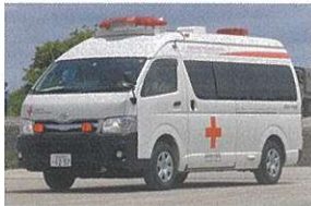
災害救護車両 1,100万円