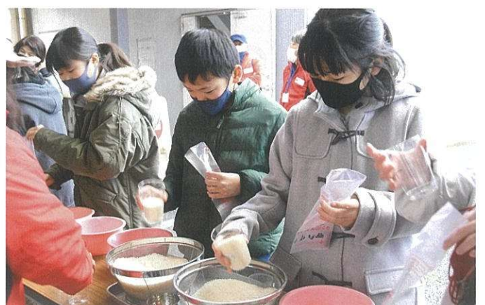
赤十字活動への参加を通じて 豊かな心をもった子どもたちの育成に取り組みます。