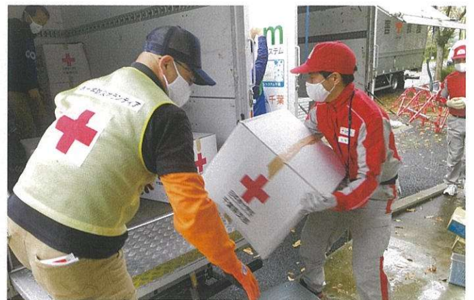
大規模災害や火災・水害等により被災された方に 迅速に救援物資をお届けします。