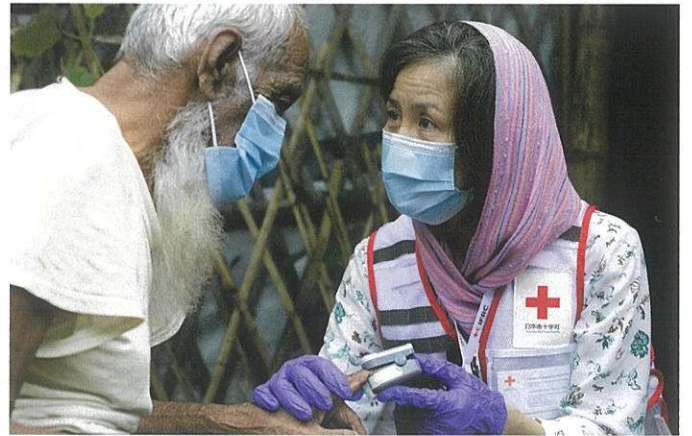
海外の紛争や災害で苦しむ人々を支援します。