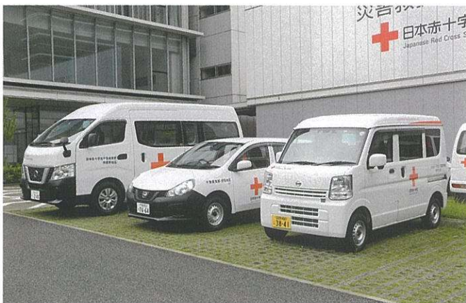
災害時に必要な施設や資機材を整備します。