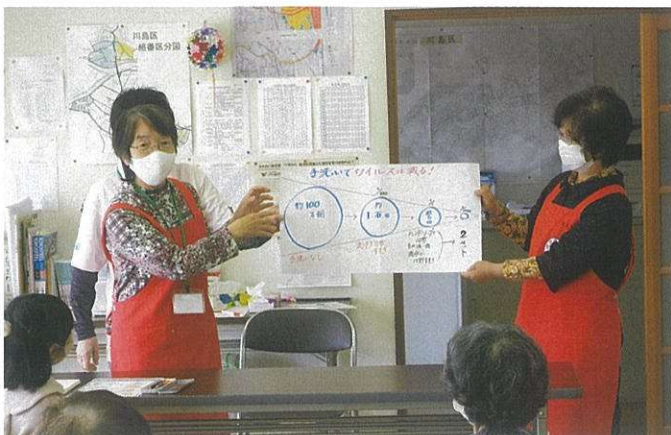
赤十字奉仕団が地域における高齢者の支援などの 様々なボランティア活動を行います。