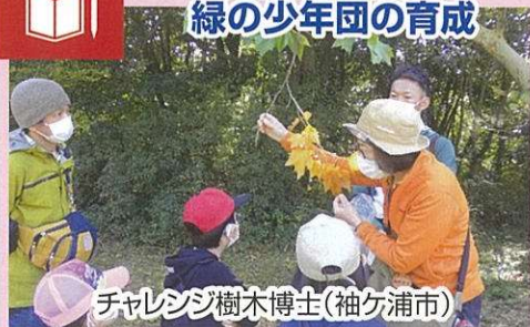
チャレンジ樹木博士(袖ヶ浦市)

緑の募金は様々な活動に活かされ、SDGs(持続可能な開発目標)の達成にも大きく貢献します。