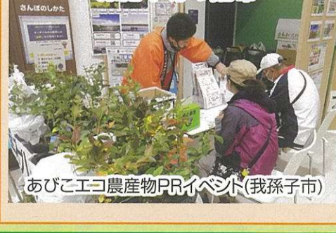
あびこエコ農産物PRイベント(我孫子市)