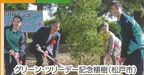
グリーン・ツリーデー記念植樹(松戸市)