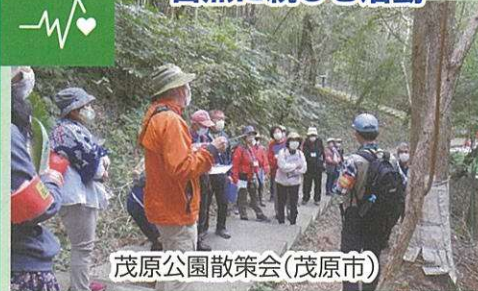
茂原公園散策会(茂原市)