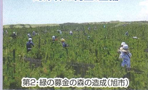
第2・緑の募金の森の造成(旭市)