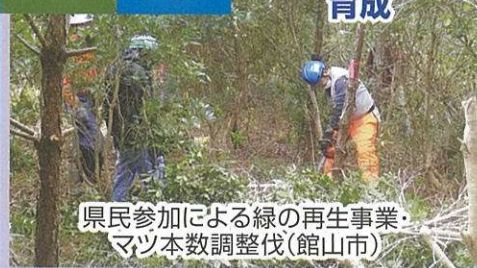
県民参加による緑の再生事業・ マツ本数調整伐(館山市)