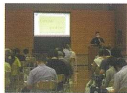
【昨年の講座の様子】

この講座では、近年多発する災害に備えて地区防災計画策定の必要性や災害対応時の確認を行い、また危険個所の把握や市の対処法等様々な情報を学び有秋地区唯一の公共施設である有秋公民館で、より住民が安全・安心に利用できるようにその対応を学びます。