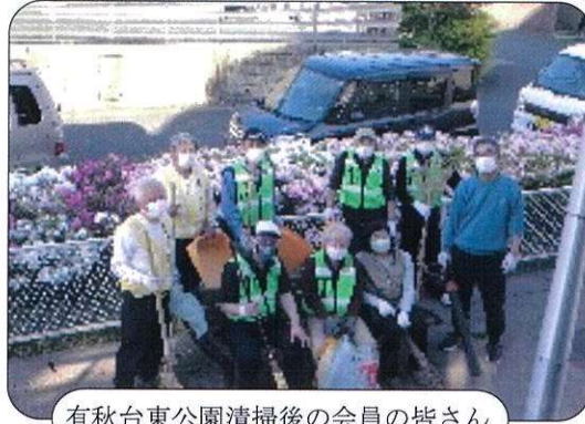
有秋台東公園清掃後の会員の皆さん