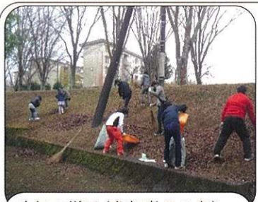
昨年の様子(参加者50名)

12月11日(土)有秋公園の大掃除を実施しました。コロナ禍のため豚汁会は中止しました。