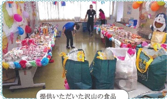
提供いただいた沢山の食品