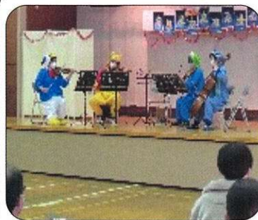
演奏者「カルテットキューン」 来場者92名

12月4日(土)有秋公民館体育室でクリスマスコンサートを開催しました。また、独居老人にクリスマスプレゼントを予定しております