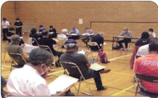
有秋地区社会福祉協議会 第1回理事会 (7/29) アネッサ体育室

具体的には、市原市第6次地域福祉計画に沿った地区行動を踏まえた事業の見直し、新事業の実施検討があります。また、一部地域での実施となつている日常生活支援事業を地区内全域に拡大して行きたいと考えています。 これらの見直し・実施にあたっては、わか