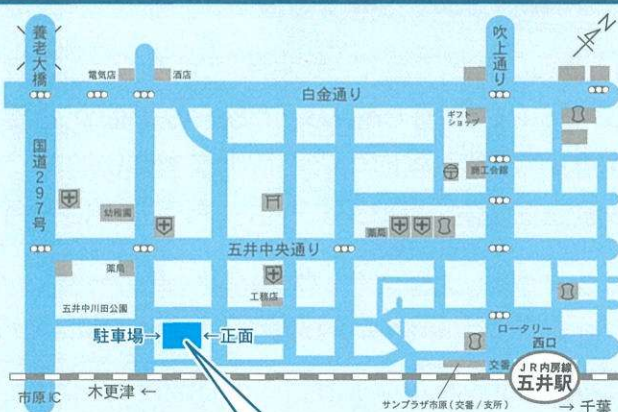
千葉県市原保健所 (市原健康福祉センター)