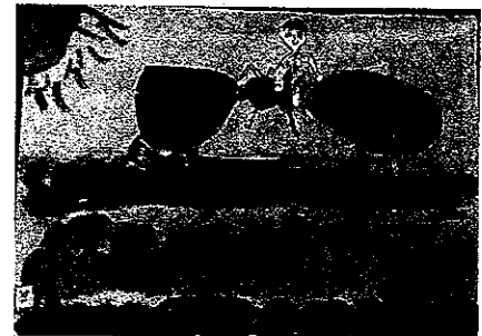
田中 圭 さん