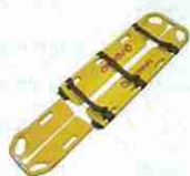
傷病者搬送用ストレッチャー