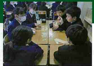
総合的な学習の時間に災害発生時の行動をグループワークを通して考えるJRCメンバー (研究推進校における公開研究会)