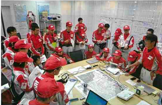
災害対策本部におけるミーティング

被害が大きい千葉県の各所に、救護班の派遣や救援物資の配布、避難所などの巡回診療などの活動を行いました。