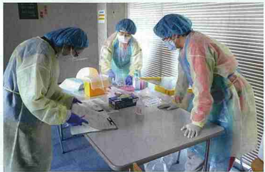
税務大学校における医療活動

皆様のご支援により、大規模災害に備えるための救護装備を整備することができました。また、被災者にお届けする救援物資を、県内9か所にある支部拠点倉庫に備蓄しています。