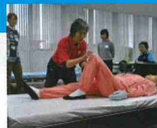
健康生活支援講習