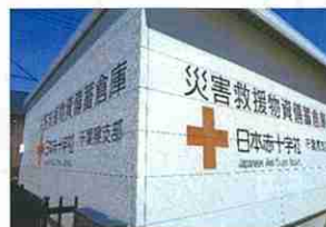
災害救援物資拠点倉庫(市川市)