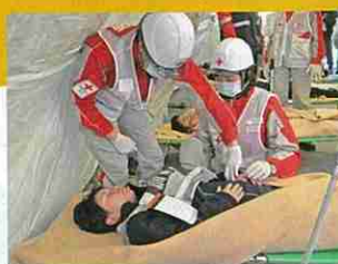
傷病者の手当をする救護班 (国民保護実働訓練)