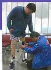
義足の調整を行う 義肢装具士