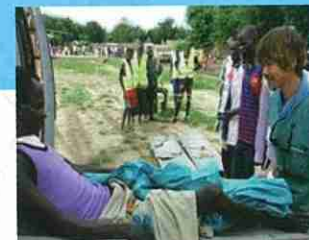
南スーダン共和国紛争犠牲者支援事業 ICRC