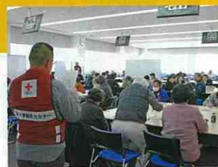
赤十字防災セミナー指導者養成講習