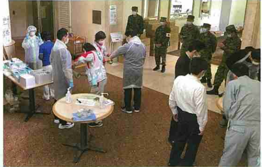
成田市内ホテルにおける医療活動

大型クルーズ船や外国からの帰国感染者対応のため医療救護班派遣。成田市内ホテルにおける医療活動を行いました。