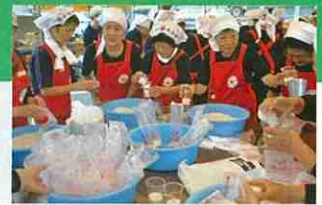
防災訓練における炊き出し