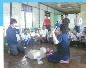
海外赤十字社救急法普及支援事業