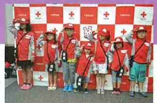
救護員体験をする子供達 (赤十字KIDS CROSS)