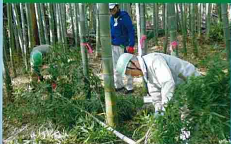
県民参加による緑の再生事業・竹林管理作業(千葉市)