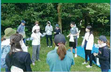
幼稚園教諭を対象にした研修会(袖ヶ浦市)