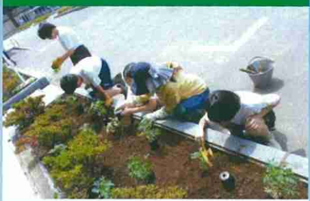
学校の緑化活動(佐倉市)