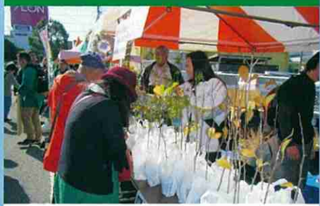
農畜産物収穫祭での配布会(木更津市)