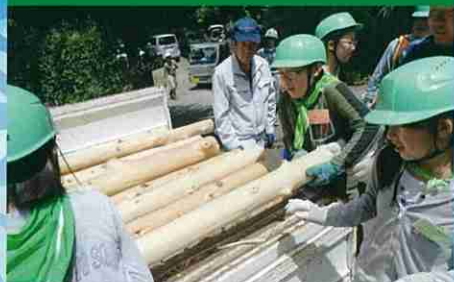
第39回緑の少年団交流会・体験林業(大多喜町)