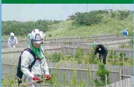
第2・緑の募金の森の造成(旭市)