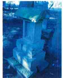
女人講が奉納した不入斗小鷹神社の祠(明治14年=1881)