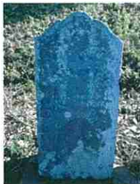
石尊大権現・浅間大明神・天保13年(1842)