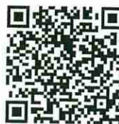
ゼブラ・ストップ活動動画