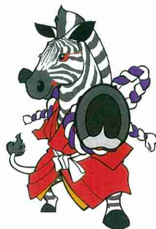
ゼブラ・ストップ活動 イメージキャラクター