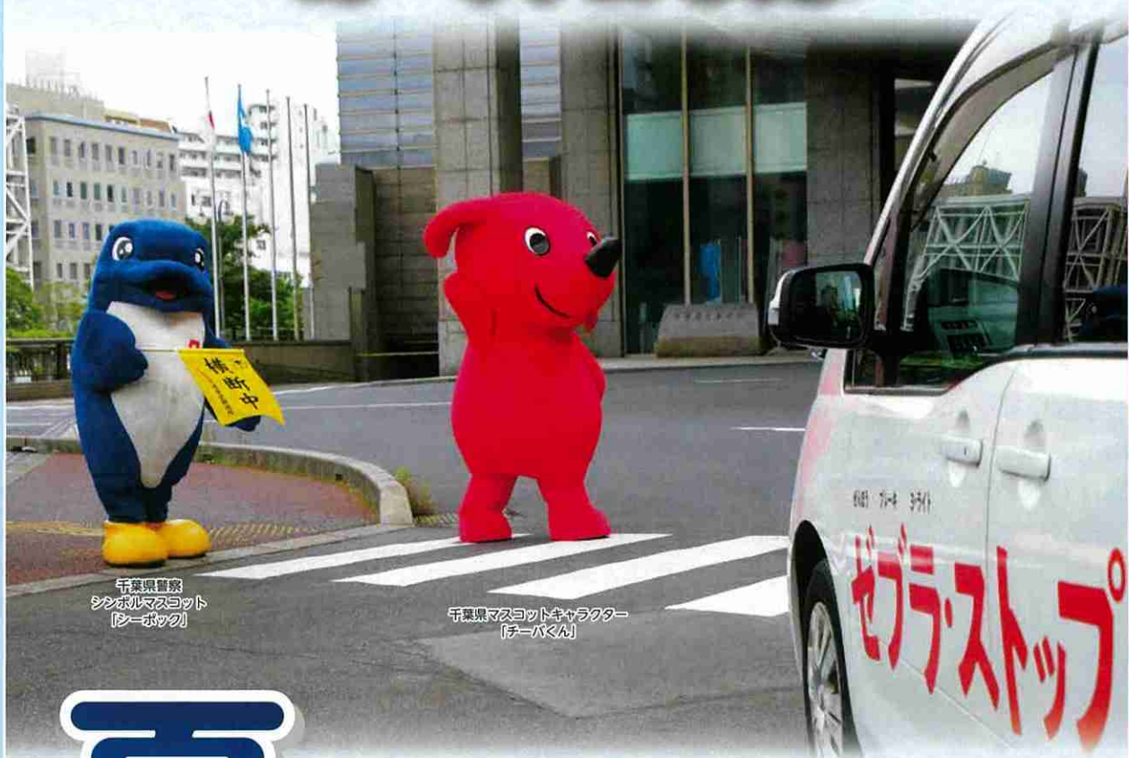
千葉県警察 シンボルマスコット 「シーボック」