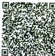
ゼブラ・ストップとは