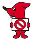
千葉県マスコットキャラクター「チーバくん」

危険ドラッグは、「ハーブ」「お香」などとあたかも安全なもののように偽って販売されている薬物で、決して「安全」でも「合法」でもありません。危険ドラッグを使用して意識障害、呼吸困難を起こした例や死亡した例もあります。