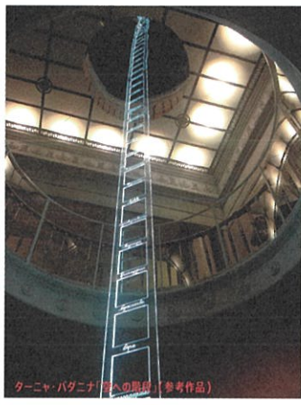
ターニャ・バダニナ「雲への階段」(参考作品)