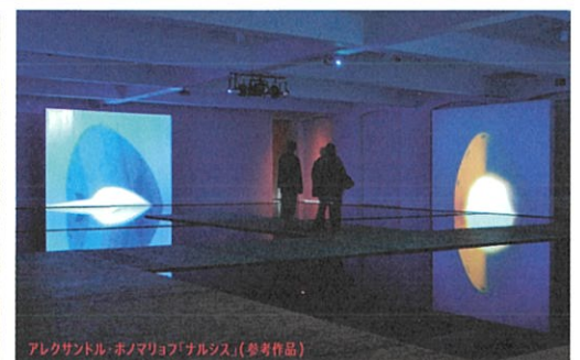
アレクサンドル・ボノマリョフ「ナルシス」(参考作品)