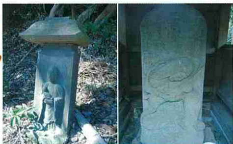
薬王寺子安地藏 寛政6年(1794)

しかし、それでも地球は回り続ける。どれだけ私たちが悲しみに暮れようと、世界は無頓着に動き続ける。けれど、それはきっといいことなのだろう。どんな時でも、変わらないものがあるというのは、きっと...」(「はじめてのマインドフルネス」クリストフ・アンドレ著 2016年 紀伊國屋書店: P.209~P.210より引用)