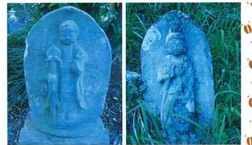
若宮西崎堂墓地地藏 元文4年(1739)

観音、子安神、子安地藏...など祀られる神仏は多種多様ですが、子を慈しむ親の思いが溢れ出るようなお像に数多く出会うことができます。特に右の喜多神社に祀られている子安神は素朴でストレートな造形が胸を打ちます。当時の出産は今よりもはるかに危険が大きく、無事出産できたとしても抱瘡や麻疹などによって幼児のうちに我が子を亡くしてしまう事は珍しくありませんでした。