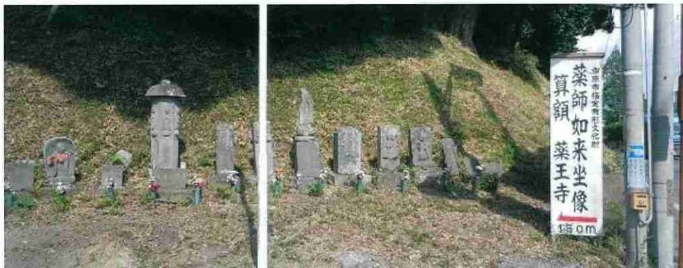
薬王寺入り口付近に祀られた石造物群

時代がどんなに変わっても人が人を愛しく思う気持ちに根本的な変化は無いでしょう。信仰心の薄れた現代人の私たちがあっても人の気持ちの優しさを伝えてくれる過去の事物はいつの間にか私たちの心を温め、穏やかに癒やしてくれるはずです。 左は薬王寺境内にある子安地藏。出産や子育てに関わる女性達の不安を和らげるべく、神仏へ祈りを捧げる子安講が村々で定期的に開かれてきました。子安