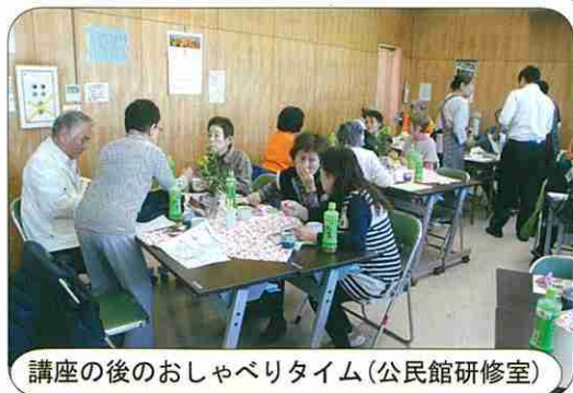
講座後のおしゃべりタイム(公民館研修室)

今回も筋トレ、脳トレなどとともに大きな声で歌ったり、大笑いしながら楽しく過ごしました。