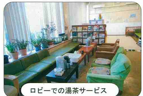
ロビーでの湯茶サービス

今回の台風15号、19号、豪雨の対応についてはロビーで湯茶のサービスと毛布・座布団の準備をし避難者が安全安心に過ごせるよう配慮しました。 避難者数 台風15号：5名 台風19号：95名 豪雨：8名