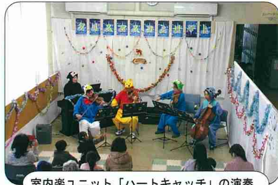
室内楽ユニット「ハートキャッチ」の演奏

社会福祉協議会の歳末助け合い運動「地域福祉支援事業」の一環で、公民館と共催でクリスマスコンサートを12月1日(日)に開催しました。