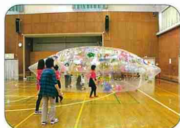
「ちびっこひろば」ドーム遊び