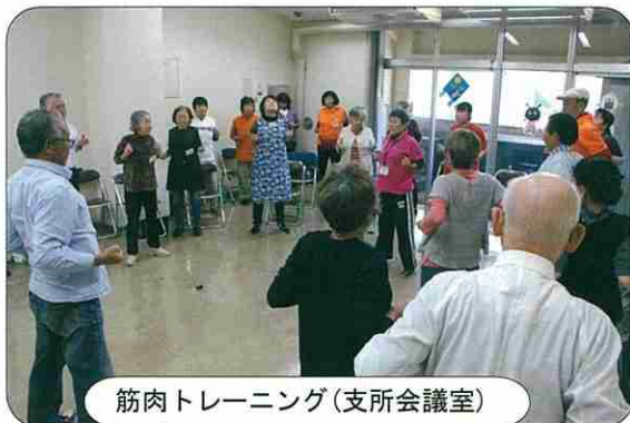
筋肉トレーニング(支所会議室)

積極的に外出し社会とのかかわりをもつことが脳トレ、筋トレになるといふことです。ぜひ茶話会にもお出かけください。