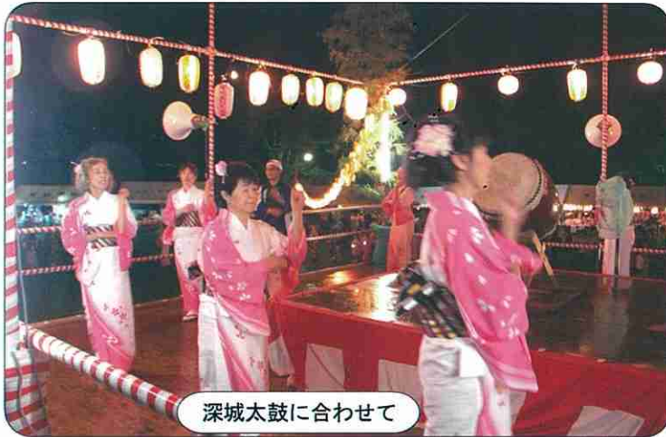
深城太鼓に合わせて

7月15日(月)有秋公園で恒例の第47回有秋地区盆踊り大会が開催されました。今年は雨天での悪条件の中、町会長と協力団体の皆様での会場設営は大変苦勞しましたが、老いも若きも一緒に組まれる櫓が完成すると地域の底力を感じました。約5,000人の来場者で賑わい、地域や家族の絆を強め、年中行事として楽しんでいます。 (実行委員長 杉原)