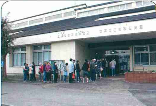
多くの方に来場いただきました

保護女性会、女性部会、ボランティア有秋、子育て家庭支援員、スポーツ推進委員、くらしのささえあい等たくさんの方々準備に汗を流していました。 当日の開場時には、食品、日用品などは直ぐに売り切れ、野菜コーナー、衣料雑貨コーナーにも人が多く集まり大盛況でした。今回のバザーに物品の提供、野菜の提供をして頂いた皆様、品物を買って頂いた皆様、寄付金を入れて頂いた皆様、ありがとうございます。来年もよろしくお願ひします。(林)