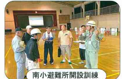
南小避難所開設訓練