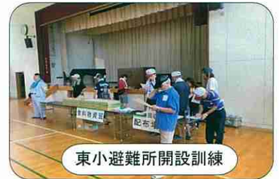
東小避難所開設訓練