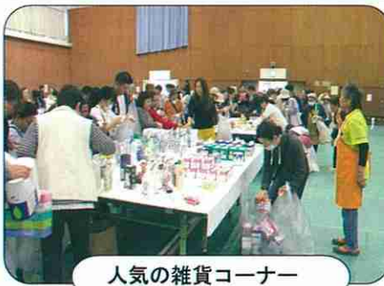
人気の雑貨コーナー

バザー売り上げ 物品売上：250,990円 焼芋売上：24,500円 寄付募金：21,530円 計：297,020円