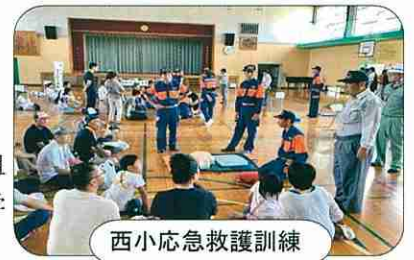
西小応急救護訓練