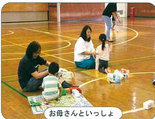
お母さんといっしょ

開催日：令和2年3月1日(日) 時間：10:30~12:00 (受付時間：10:00~) 場所：有秋公民館体育室 0歳児~5歳児、参加費無料