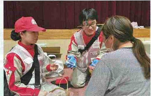
巡回診療を実施する成田赤十字病院救護班

皆様のご支援により、大規模災害に備えるための救護装備を整備することができました。また、被災者にお届けする救援物資を、県内9か所にある支部拠点倉庫に備蓄しています。