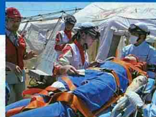
傷病者の手当をする救護班 (九都県市合同防災訓練・勝浦市)