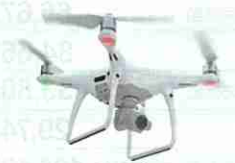
災害時空撮用ドローン