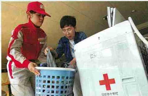
断水が続く地域に給水・衛生チームを派遣し、洗濯支援サービスを実施