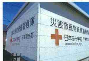
災害救援物資拠点倉庫(市川市)