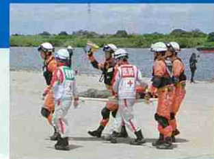
消防隊員と連携して傷病者を搬送する救護班 (利根川水系連合総合水防演習)