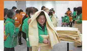
災害時に役立つ毛布ガウンの作り方 (赤十字奉仕団による講習会)