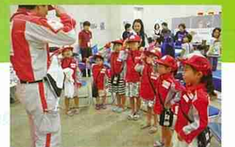
救護員、看護師体験をする子どもたち (赤十字KIDS CROSS)