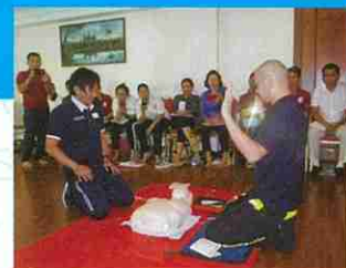
AEDを用いた救命処置の実技 (カンボジア赤十字社救急法普及支援事業)