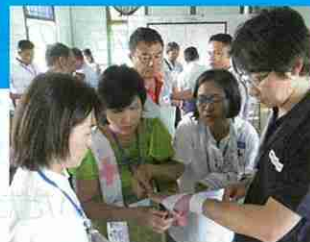
包帯の巻き方を指導する指導員 (ミャンマー赤十字社救急法普及支援事業)