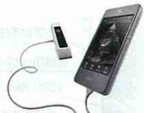
携帯用超音波診断装置(エコ)