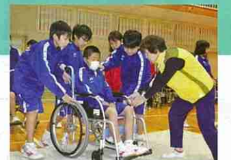
青少年赤十字採用校の高齢者福祉体験学習