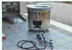
災害用移動炊飯器