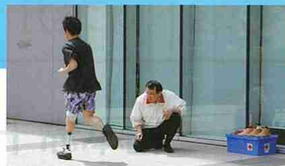
義足の性能確認を行う 義肢装具士