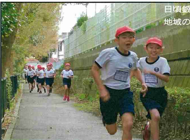
日頃鍛えたこの体。ゴールに向けて一直線。地域の皆さまご声援有難うございました。