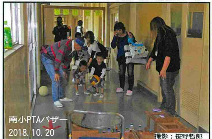
南小PTAバザー 2018. 10. 20