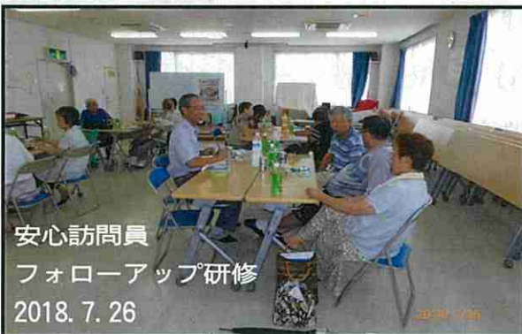
安心訪問員 フォローアップ研修 2018. 7. 26