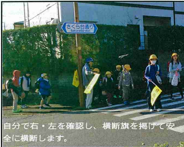
自分で右・左を確認し、横断旗を掲げて安全に横断します。