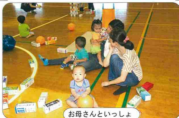
お母さんといっしょ

開催日：平成31年2月25日(月) 時間：10:30~12:00 (受付時間：10:00~) 場所：有秋公民館体育室 0歳児~5歳児、参加費無料