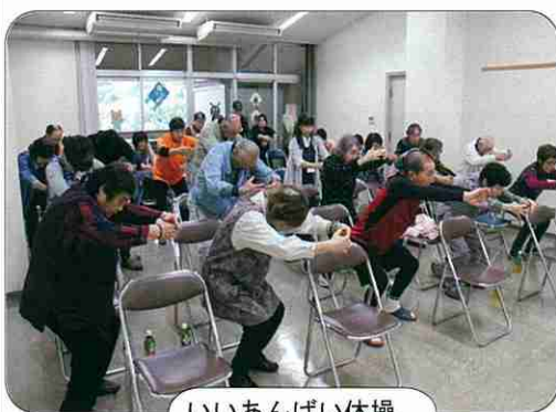
いいあんばい体操

講座では、第一部青い山脈の曲にのり、市原市「いいあんばい体操」や四季のうたに合わせフオークダンス?、両手を使った脳トレは大変盛り上がり汗をかきました。第二部これからシーズンを迎えるインフルエンザの予防と対処法、まずは予防接種を受けましょう。加えて健康管理では休息、睡眠、一日三回の食事、手洗いだそうです。かかったら病院へ受診後は水分補給、処方薬は最後まで飲み切りましょう。テレビ等の情報キャッチもお忘れなく。 (東島)