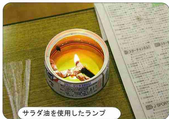
サラダ油を使用したランプ

体験訓練では、保温性のある新聞紙の活用、灯の確保では身の回りにある廃油やサラダ油でオイルランプ作り、日常生活にも役立つ便利な技術でロープワークの基本を、その他レジ袋の活用、ペットボトルの活用を学んだ。