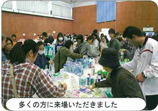
多くの方に来場いただきました

10月28日(日)秋 天、有秋公民館体育 室で、有秋地区福祉 バザーが開催されま した。 穏やかな青空の下、 早朝よりたくさんの方 々が開場を前に列を 作っていました。列 を各町会より集められ た、贈答品や日用雑 貨・食器・衣類等の 数々は、数十円から 数百円と大変リーズ ナブルで、30分程で ほぼ完売となってい ました。中でも有秋