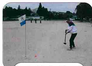
ナイスパーディー (グラウンドゴルフ)

11月4日(日)有秋東小学校グラウンドで、グラウンドゴルフ大会が開催され、約50名の参加者が日頃の練習の成果を披露した。その後、体育館でボッチャ大会が開催された。ボッチャは初めてという人が殆どで、役員からルールを熱心に聴き、見ながら上手に遊べる楽しさを味わった。大沼