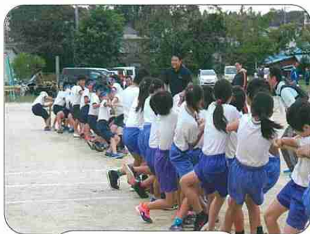
小学校対抗綱引き

☆小学校対抗綱引き優勝…有秋東小学校 ☆小学校対抗リレー優勝…有秋西小学校 ☆準優勝…赤チーム（片又木、迎田、永藤、迎田住宅、日産化学、日本燐酸有秋東二丁目第一、有秋東二丁目第二） ☆優勝…エンジチーム（緑園都市町会）