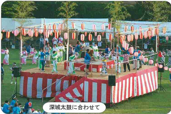
深城太鼓に合わせて