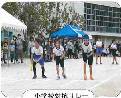
小学校対抗リレー