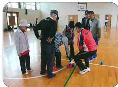
ボッチャのルール説明