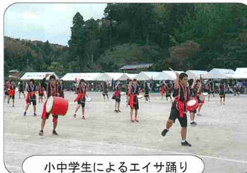
小中学生によるエイサ踊り