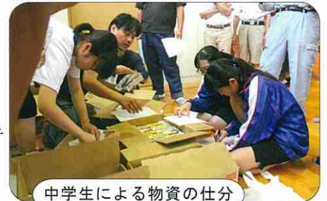
中学生による物資の仕方