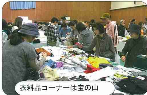
衣料品コーナーは宝の山

積まされた光景 は、買った野 外で、焼きた 芋の味は、漂 々とした。今 日は、美味しい 品が、出ると いう、お話を 聞きました。