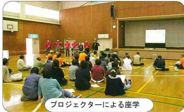
プロジェクターによる座学

災害発災時に避難所においてどういった対応ができるのか11月10日(土)有秋公民館体育室で47名の参加を得て訓練が行われた。 災害が発生するとどうなるのか? 3・3・3・7で生き延びよう! (3分間自分で守る、3時間両隣の見守りや救助、3日間地域の力の結集、7日分の備蓄で生き延びる)等プロジェクトで学んだ。