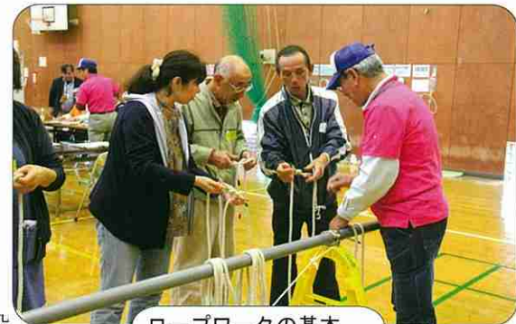
ロープワークの基本

体験訓練では、保温性のある新聞紙の活用、灯の確保では身の回りにある廃油やサラダ油でオイルランプ作り、日常生活にも役立つ便利な技術でロープワークの基本を、その他レジ袋の活用、ペットボトルの活用を学んだ。