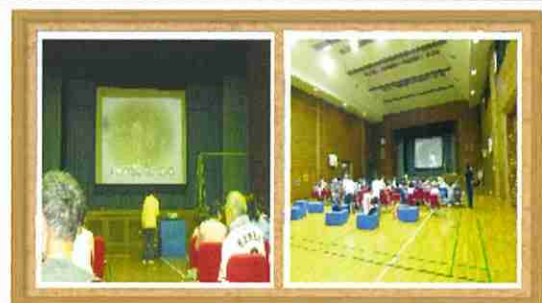
「ミュージッククラブ」の活動の様子

これまで専門的クラブとして活動していたサッカー・バドミントン・ゲートボール等のクラブを統合し、今年度から新たにスポーツクラブとして活動しております。オープン参加型のクラブとして、参加いただく利用者の皆様に楽しんでいただけるよう様々な活動プログラムを企画・運営しております。今後とも当クラブを何卒よろしくお願いたします。 ミュージッククラブでは、利用者の皆様が大好きな「音楽」を用いた活動(歌う・踊る・リラックス(歌う・踊る・リラックス)の場を提供しています。第1回目の開催から現在に至るまで多数の方に参加いただいております。課題も多々ありますが、試行錯誤を重ね、更なる充実したクラブ活動となるよう職員一同、一丸となって日々取り組んで参ります。