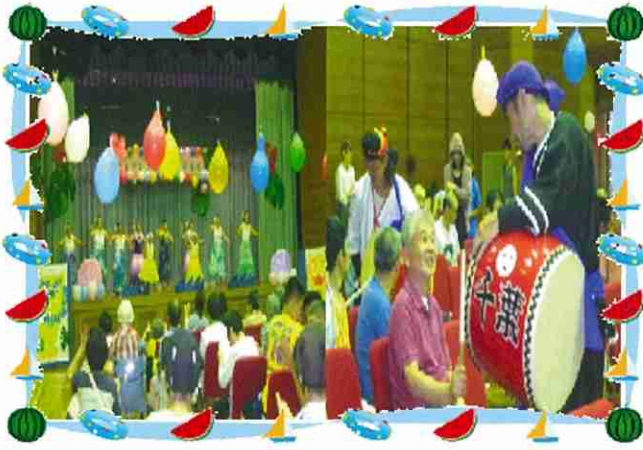
「夏ソングまつり 2018」の様子