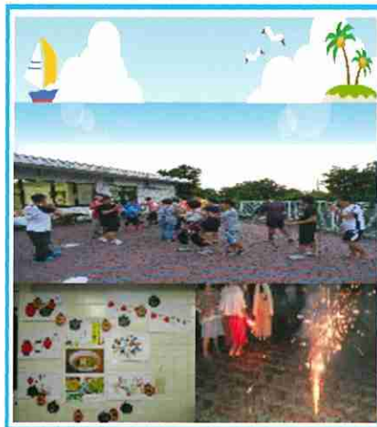
「児童寮」の夏休みの様子

ひまわり寮では、夏の定番レジャーであるプールをはじめ、流しそうめんをしたり、皆でお部屋を提灯で飾り付け、お祭り気分で盛岡冷麺を食べたりと、大変賑やかな夏休みとなりました。夏休みの締めくくりには、手持ち花火をし、子ども達にとって楽しい思い出いっぱい夏の休みになったようです。