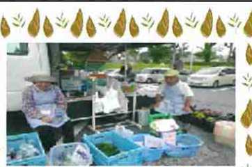
先回のふれあい市の様子

当園では、年に3〜4回、市原市の有秋プラザ駐車場内にて「ふれあい市(農作物や手工芸品の販売)」を開催しています。利用者さんの体力の低下等に配慮し、ここ数年の販売活動は職員のみで行っていましたが、ある日、屋外科の利用者