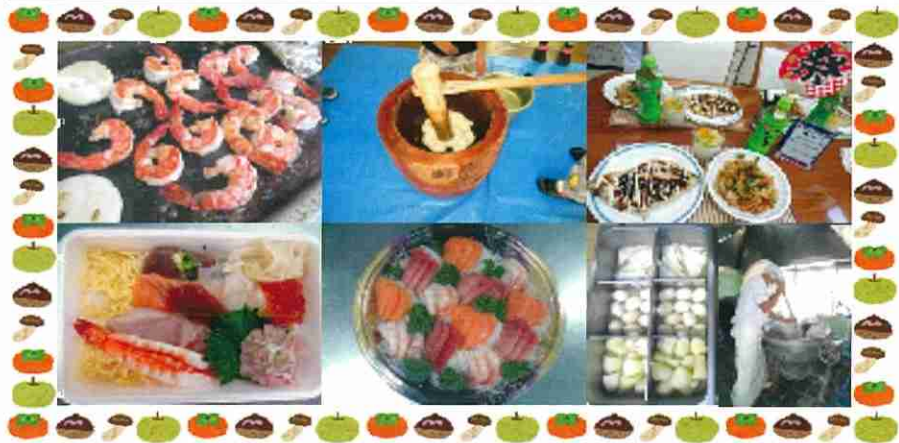
多種多様な献立メニューの一部をご紹介します♪

(左上から) お好み献立 (BBQ・餅つき)、出張調理 (お好み焼き・焼きそば) (左下から) 出前シリーズ (寿司・刺身・おでん) / (右下) 調理風景