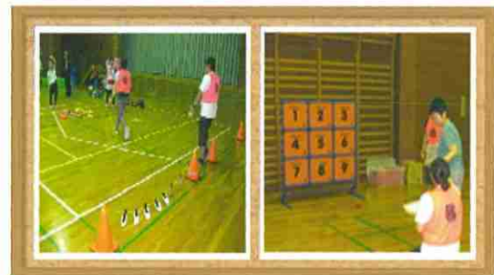
「スポーツクラブ」の活動の様子