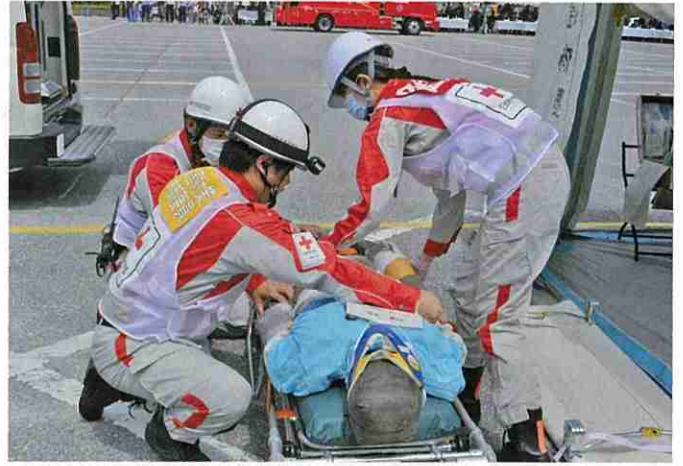
災害救護訓練「救護班による傷病者搬送」