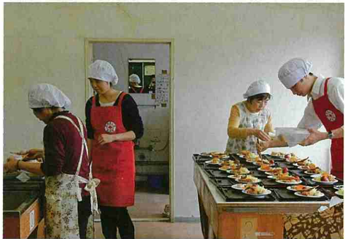
赤十字奉仕団による高齢者の支援活動(君津市・里の家)