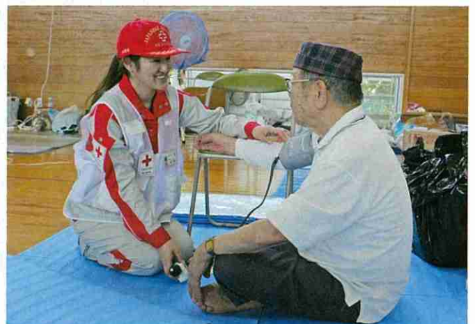
平成30年7月豪雨災害 岡山県倉敷市避難所にて巡回診療を実施