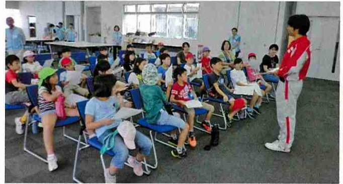
子どもたちを対象とした防災教育