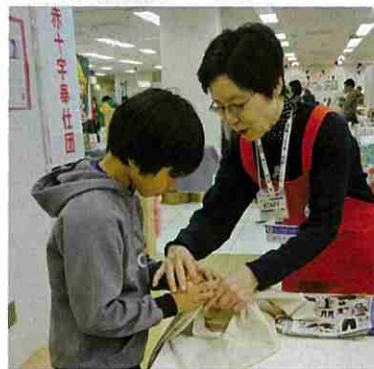
風呂敷を使ったリュック作成(赤十字奉仕団イベント)