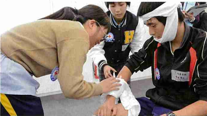
傷病者の手当を学ぶ講習(青少年赤十字のつどい)