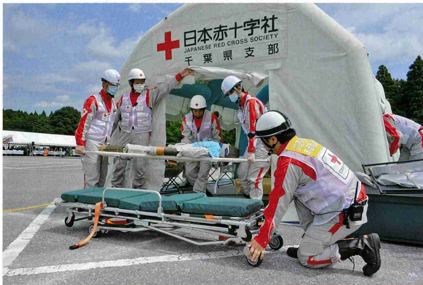
災害への対応を想定し、訓練を行っています。

日本赤十字社が行っている国内の災害救護活動、救急法などの講習普及事業、青少年赤十字活動、国際救援活動など様々な活動は、国や県などの補助金によらず、赤十字の活動にご賛同いただいた皆様からの活動資金によって支えられています。