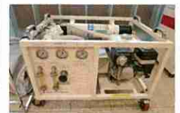
緊急災害用浄水器