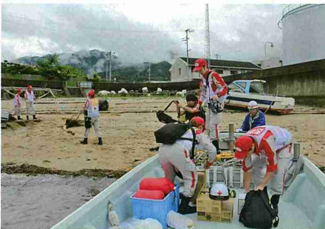
平成30年7月豪雨災害 直ちに広島県の被災地に向かう医療救護班

日本赤十字社は、苦しんでいる人を救いたい という思いを結集し、人のいのちと健康、尊厳を守ることを使命として、 世界191か国に組織された赤十字・赤新月社と連携し、 国内外において様々な 人道的活動を展開しています。