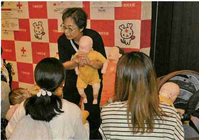
幼児安全法の講習