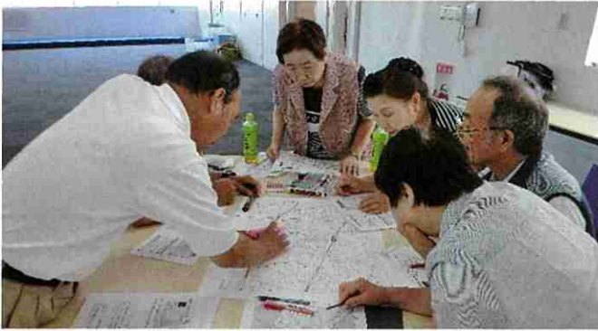
防災上の資源等の把握(災害図上訓練)

いのちを守り被害を最小限に抑え、地域における“自助”“共助”の力を高めるため、防災・減災セミナーやイベントを開催しました。