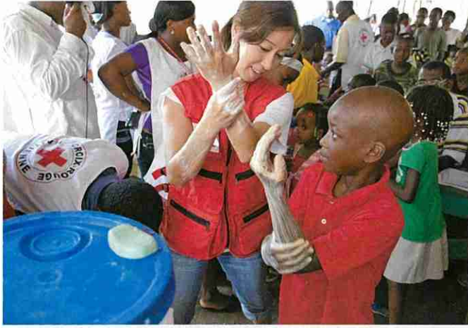
国外における保健衛生活動「手洗い指導」(ハイチ)