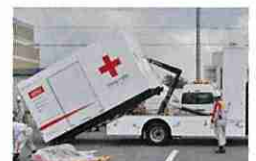
緊急対応ユニット