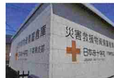
災害救援物資拠点倉庫(市川市)