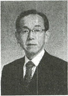
教育長 林 充

教育は人づくり！！ 優しさは教養から、教養は教育から、教育（家庭教育・学校教育）こそが 子どもたちを幸せに！！ めざすは「文武両道！」