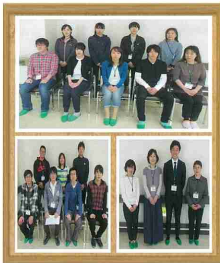
平成30年4月1日付新入・転入職員等