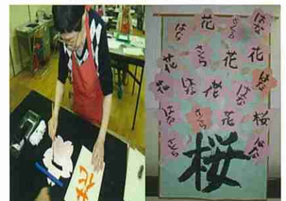
「書道」の活動の様子

活動支援グループでは、利用者の皆様の生活を豊かにするための活動を数多く行っております。昨年度は、日中活動のより一層の充実を目指し、多くのボランティアの方々にご協力をいただき、フラダンス・レクダンス・ポッチャなど様々な活動を実施いたしました。今回は、その中から「茶道」と「書道」の活動の様子をご紹介します。