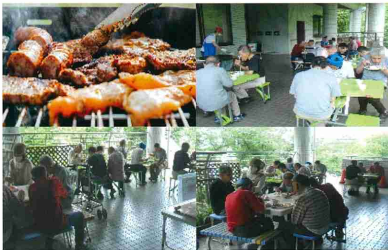
BBQと言えばやっぱりお肉だよね♪アウトドアで楽しむBBQって最高！！