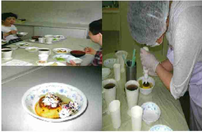
「どこから食べようかな〜♪」 「かわいいプリンだねっ♡」