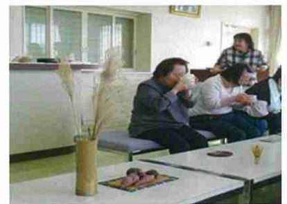
「茶道」の活動の様子