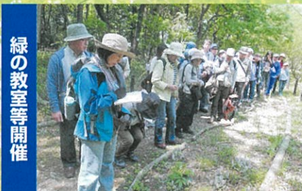
みどりの重要性を普及・啓発します こんぶくろ池・春の自然観察会(柏市)