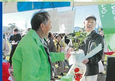
家庭からのみどりづくりを推進 旭市産業まつりでの配布会(旭市)