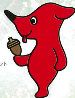
千葉県PRマスコット キャラクター 「チーバくん」 千葉県許諾 第A1072-4号

募金期間 春季：3月1日～5月31日 秋季：9月1日～10月31日 目標額 3,300万円 後援：千葉県・千葉県市長会・千葉県町村会