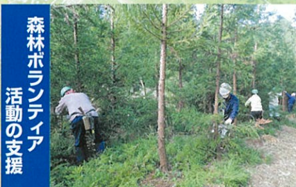
ボランティアによる森づくりを応援します 県民参加による緑の再生事業・人工林の枝打(富津市)