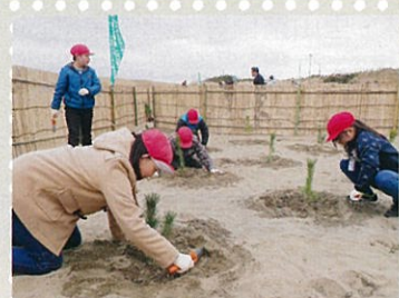
旭復興事業2017・植樹(旭市)

津波被害等が甚大な海岸林において、緑の募金中央事業として、市町村と連携した植樹等を行っています。