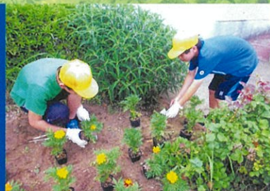
私たちの街にみどりをありがとう 学校の緑化活動(佐倉市)