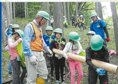
未来のみどりは僕たち私たちが守り育てます 第37回緑の少年団交流集会・体験林業(大多喜町)