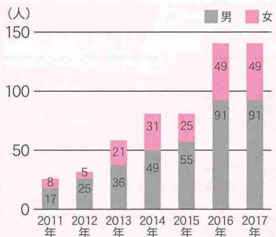
2011年～2017年 千葉県梅毒報告数