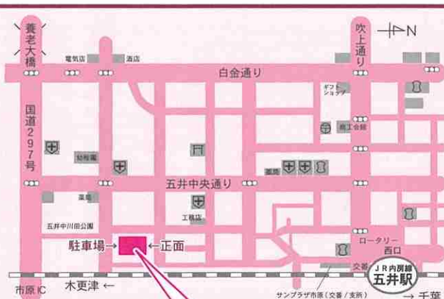
千葉県市原健康福祉センター(市原保健所)