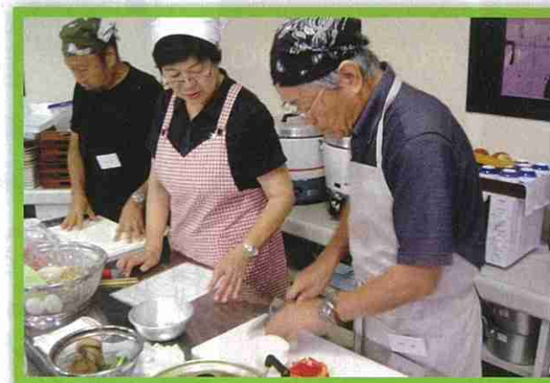
男の料理教室 / (御宿町)

男の料理教室は、料理の他に、健康や栄養のことまで学べる所が人気で、高齢者が元気で過ごせる町作りに役立っています。また、この教室に参加した受講生の皆さんが、 地域へ参加するきっかけ にもなり生きがい作りにもひと役買っています。