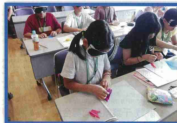
福祉体験教室 / (我孫子市)

毎年夏休みに小学生福祉体験教室を開催しています。写真は、視覚障がい者体験で、アイマスクを着けて、折り紙を折っているところです。共同募金は、 子ども達の心を育む活動 にも使われています。