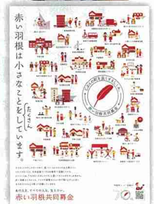
平成29年度 赤い羽根共同募金ポスター