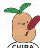
寄付付きピンバッジ (びわびよ)