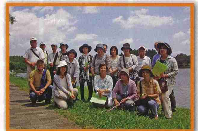
福島県からの避難者交流会 / (わかば「お茶っこ」しよう会)

たくさんの避難者の方々とお会いできておしゃべりが出来ました。皆さんにとって良い息抜きになったと思います。苦悩や楽しみ、今後についても聞けてよかったです。 このような機会をくださった寄付者の皆さまに心より感謝申し上げます。