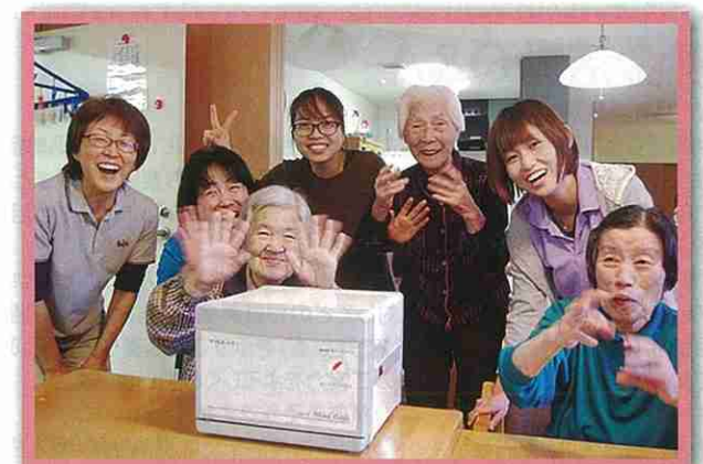
高齢者施設への備品購入 / (千葉市)

新しいタオルウォーマーをいただき、入居様に気持ち良く清拭をしていただけるので、職員も大変喜んでおります。 みんなで大切に使わせていただきます。 本当にありがとうございました。