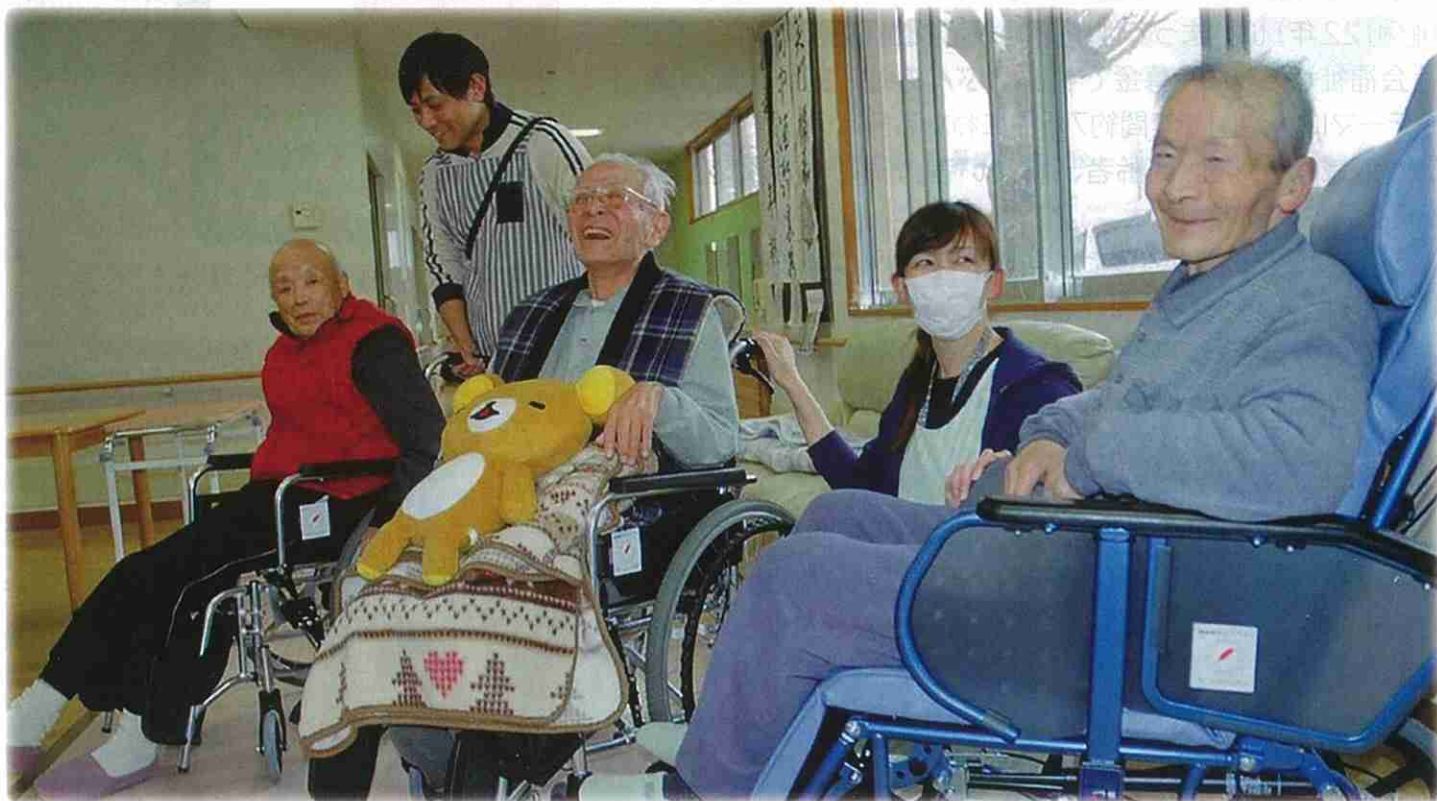
リクライニング車いすを購入したことで、快適で安全な生活を維持することができます。(特別養護老人ホーム/多古町)

平成28年度の共同募金に6億9008万円余りのご協力をいただきありがとうございました。