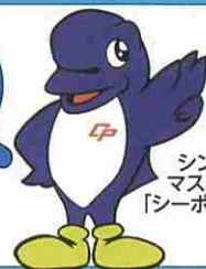
シンボル マスコット 「シーボック」

発行者 千葉県警察本部 〒260-8668 千葉市中央区長洲1丁目9番1号 ☎043-201-0110