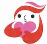
犯罪被害者等支援シンボルマーク「ギョットちゃん」